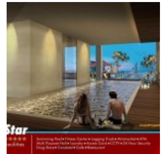
Pool Grand Pancoran Apartment