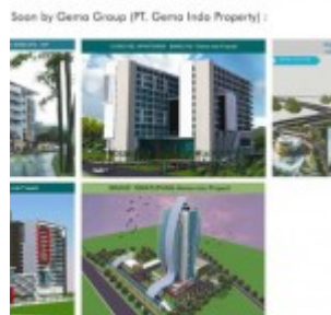
Proyek Baru Gema Indo