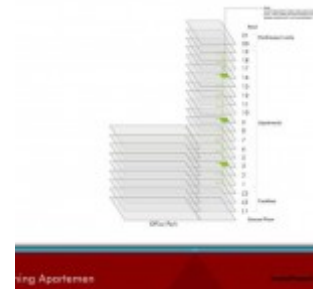
Lantai Apartemen Grand Pancoran