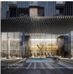
Yukata Apartment Lobby