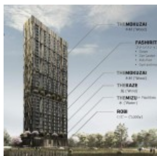
Yukata Suites Apartmen