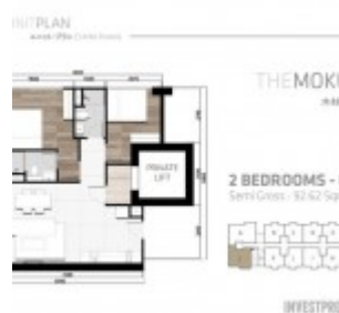
Tipe 2 BR Corner