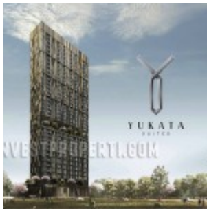
Apartemen Yukata Alam Sutera