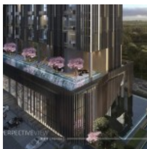
Yukata Apartment Alam Sutera