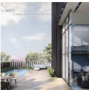
Yukata Suites The Mizu

Nama Proyek : YUKATA Suites @ Alam Sutera.