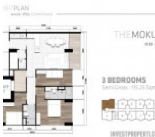
Tipe 3 BR

Mengapa YUKATA Suites adalah pilihan investasi properti yang sangat menguntungkan?