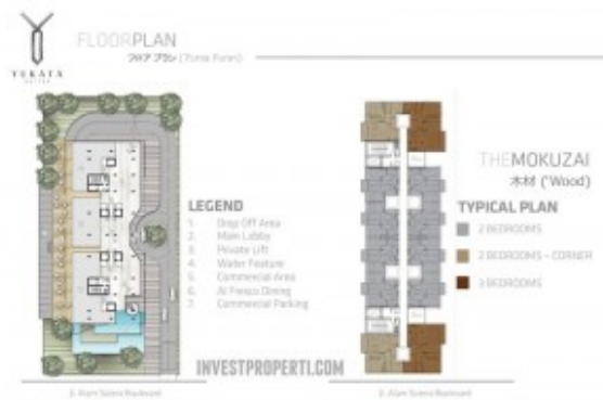
Apartemen Yukata Suites Floor Plan

Berikut dibawah adalah layout untuk Yukata AlSut type Mizu.