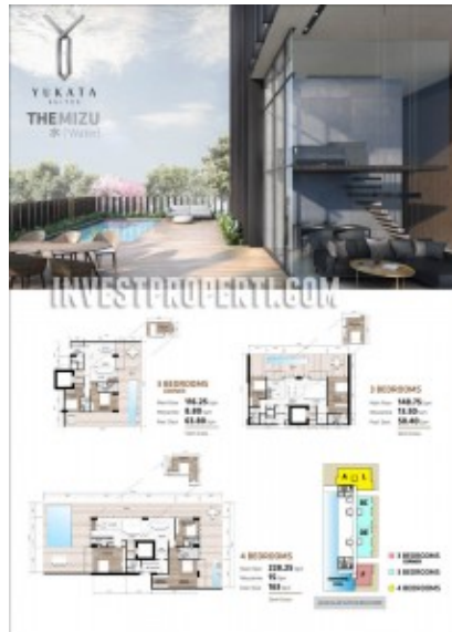
Yukata Alam Sutera – The Mizu 3BR Corner