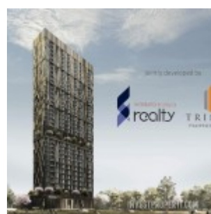
Yukata Suites – Trinitti dan Waskita