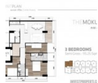
Tipe 3 BR