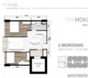
Tipe 2 BR