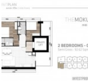
Tipe 2 BR Corner