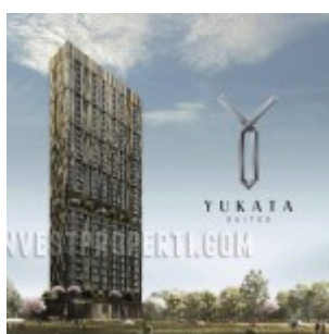
Apartemen Yukata Alam Sutera