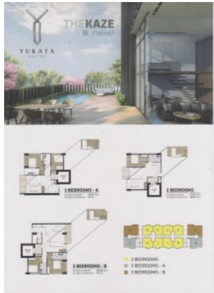
Type Unit The Kaze Yukata Suites Alam Sutera