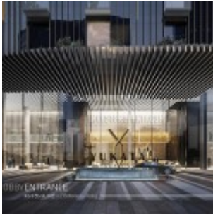
Yukata Apartment Lobby