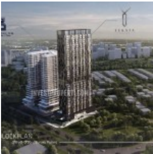
Yukata Suites Sebelah Brooklyn Alam Sutera