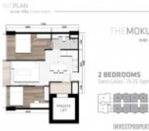
Tipe 2 BR