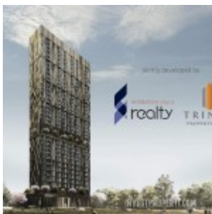
Yukata Suites – Trinito dan Waskita