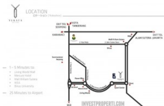
Yukata Suites Location