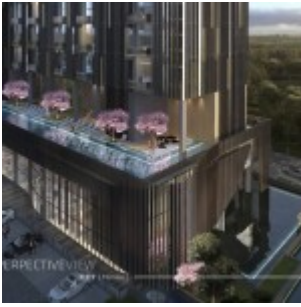
Yukata Apartment Alam Sutera