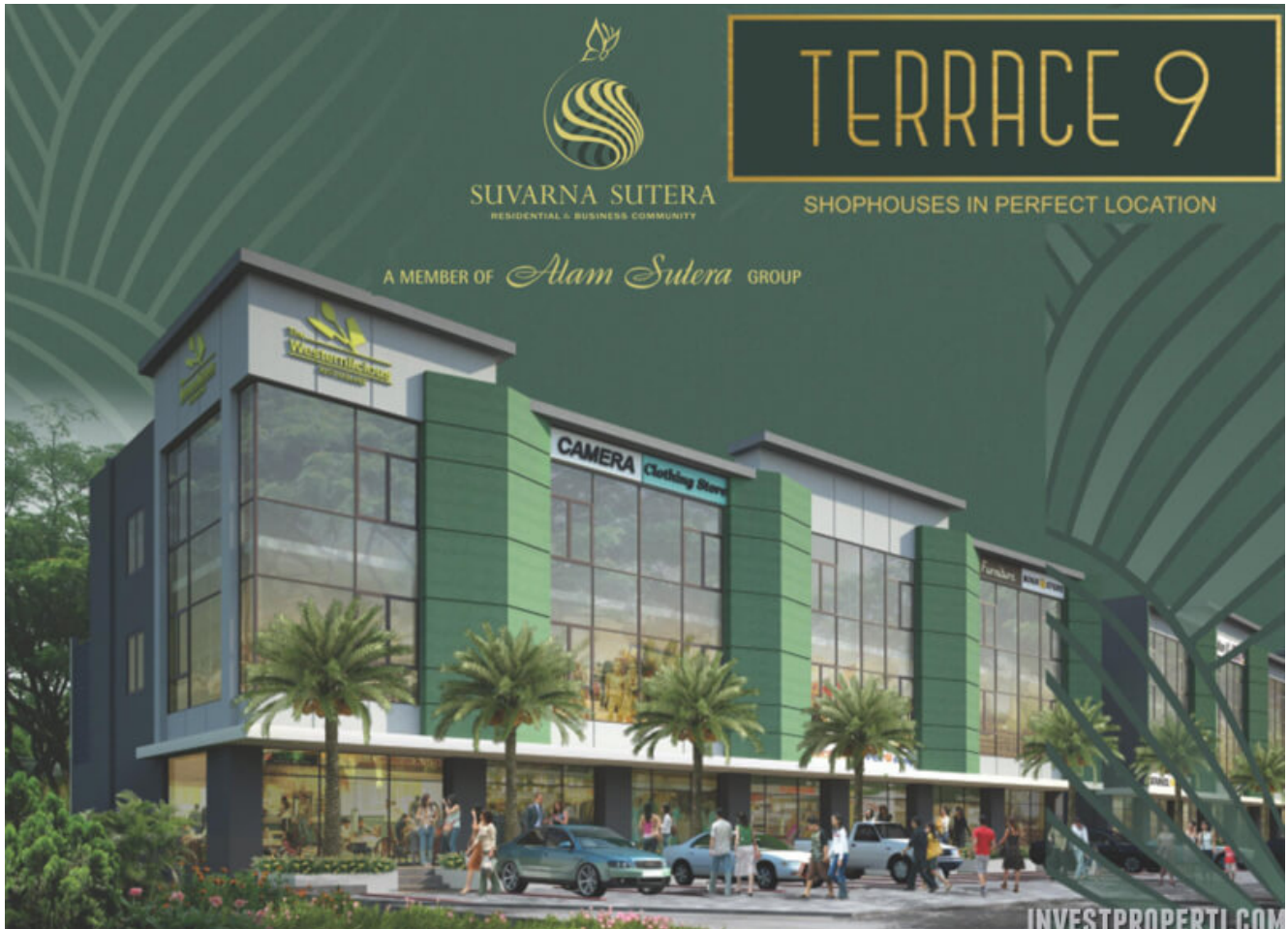
Ruko Terrace 9 Suvarna Sutera

Launching penjualan ruko baru di Suvarna Sutera, dengan nama Terrace 9 Shophouses. Ruko Terrace 9 memiliki lokasi yang sangat strategis di Suvarna Sutera, Pasar Kemis, Tangerang sebuah kawasan residensial baru seluas 2600 hektar. Harga jual ruko Terrace 9 Suvarna Sutera mulai daripada Rp. 1,9 miliaran.