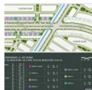
Site Plan Ruko Terrace 9 Suvarna Sutera