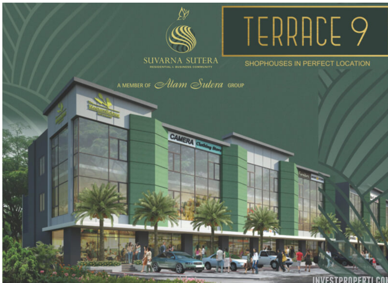
Ruko Terrace 9 Suvarna Sutera

Launching penjualan ruko baru di Suvarna Sutera , dengan nama Terrace 9 Shophouses . Ruko Terrace 9 memiliki lokasi yang sangat strategis di Suvarna Sutera, Pasar Kemis, Tangerang sebuah kawasan residensial baru seluas 2600 hektar. Harga jual ruko Terrace 9 Suvarna Sutera mulai daripada Rp. 1,9 miliaran.