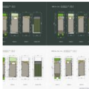
Denah Ruko Terrace 9 Suvarna Sutera

9 keunggulan Ruko Terrace 9 Suvarna Sutera sehingga layak dijadikan media investasi properti baru 2017 ataupun untuk melebarkan sayap bisnis anda, dengan pertimbangan sebagai berikut: