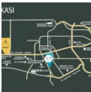
Peta Lokasi Suvarna Sutera

Potensi investasi properti dan pengembangan bisnis yang menjanjikan dimana lokasi ruko Terrace 9 berada di jalan utama Suvarna Sutera dengan 4 jalur mobil. Setiap ruko menghadap ke jalan utama dengan lokasi yang dekat dengan sekolah Santa Alurensia dan Kampus Suvarna Sutera. Belum lagi lokasinya yang dikelilingi oleh 10 cluster perumahan Suvarna Sutera.