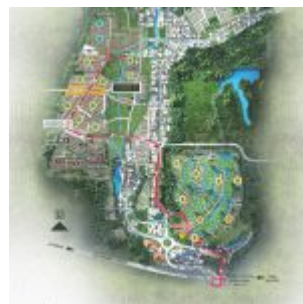
Master Plan Suvarna Sutera