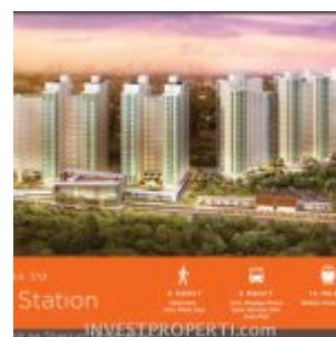
Apartemen Serpong Garden Dekat Cisauk