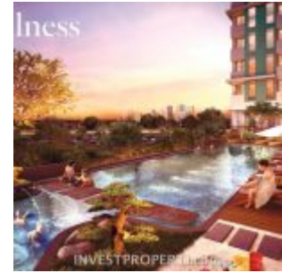
Tower Bellerosa Serpong Garden Pool