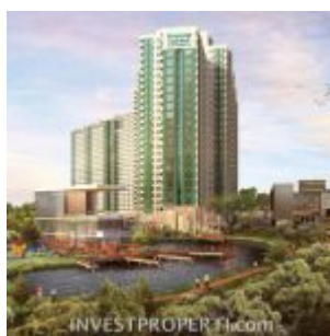
Serpong Garden Apartment