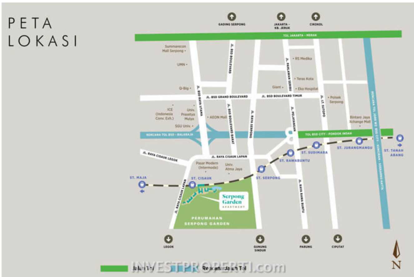
Peta Lokasi Apartemen Serpong Garden

Nama Proyek : Apartemen Serpong Garden (SEGAR)