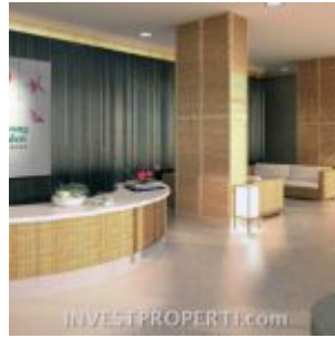
Lobby Apartemen Bellerosa Serpong Garden