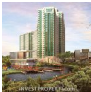
Serpong Garden Apartment