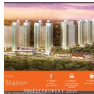
Apartemen Serpong Garden Dekat Cisauk