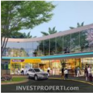
Sky Bridge Apartemen Cisauk