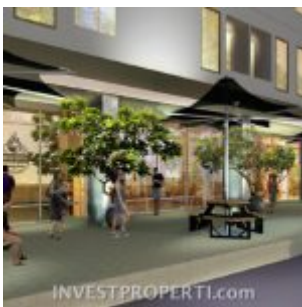
Shopping Arcade Serpong Garden Apartment