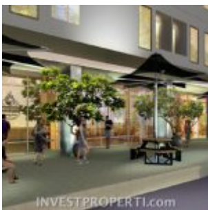
Shopping Arcade Serpong Garden Apartment