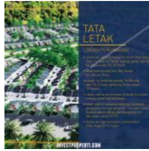
Site Plan Green Golf City