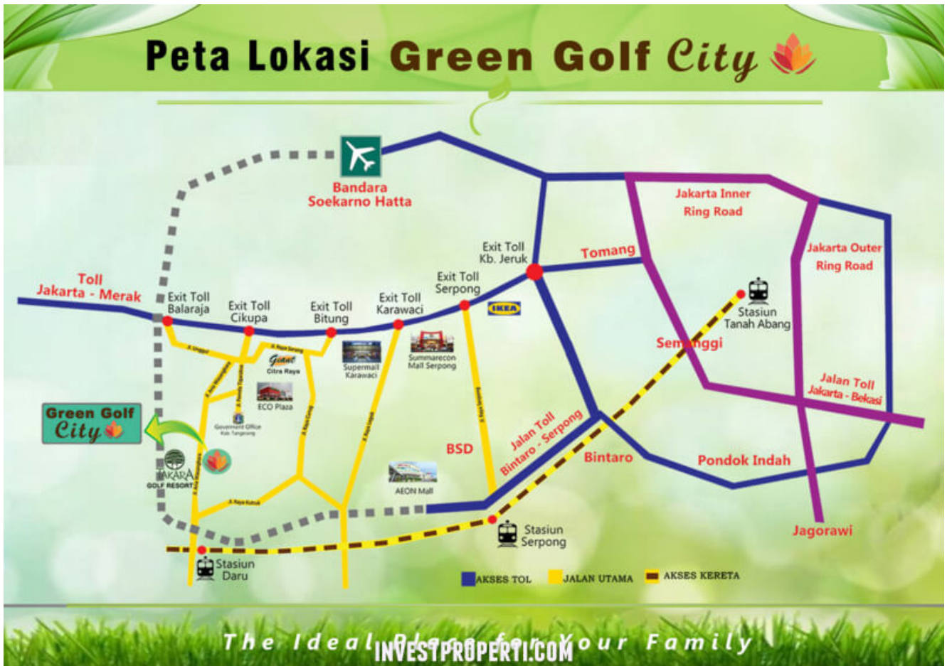
Peta Lokasi Green Golf City

Akses menuju perumahan Green Golf City beragam, dimana: