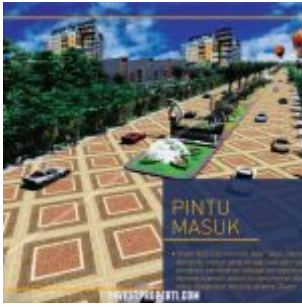
Jalan Masuk Kawasan Green Golf City