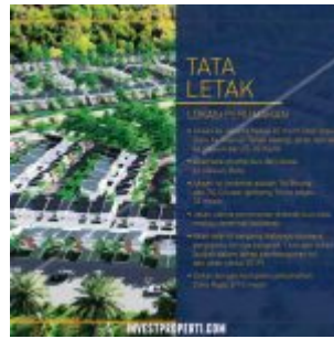
Site Plan Green Golf City