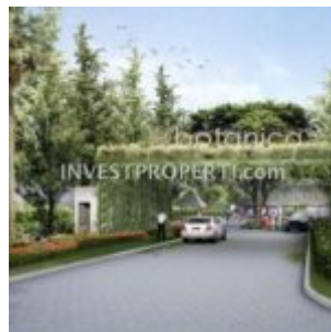
Gate Cluster Botanica Vida Bekasi