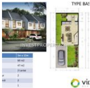
Tipe Basil Cluster Botanica Vida Bekasi