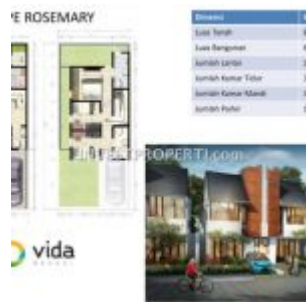
Tipe Rosemary Cluster Botanica Vida Bekasi