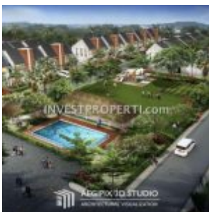
Cluster Botanica Vida Bekasi

Vida Bekasi segera me-launching cluster terbaru Botanica pada 2017 dengan harga jual perdana rumah murah daripada Rp. 495 jutaan. Botanica merupakan cluster ke-5 di kawasan Vida Bekasi, yang berlokasi di distrik Bumipala yang telah dihuni lebih dari 10.000 warga setelah cluster Premier Savanna , taman Apel, taman Durian dan taman Frambosa.