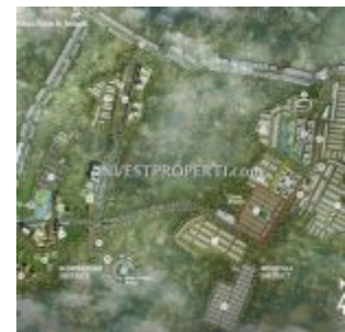
Cluster Botanica Vida Bekasi Location

Konsep perumahan cluster Botanica yang asri dan dengan alam ditawarkan dengan bangunan rumah dibuat adaptif terhadap iklim serta ramah lingkungan. Design landscape pada jalur hijau diisi dengan kebun-kebun pangan yang terdiri dari pohon buah, tanaman sayur dan herbal. Kondisi hijau kawasan cluster Botanica Vida Bekasi akan memberikan udara segar setiap harinya.