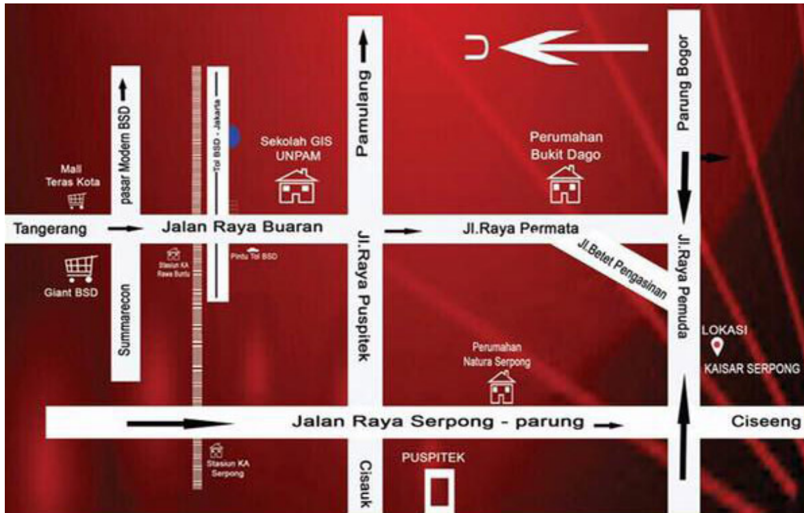
Peta Lokasi Rumah Kaisar Serpong

Lokasi strategis dekat jalan utama membuat perumahan Kaisar Serpong potensial untuk dijadikan hunian idaman ataupun investasi properti terbaru tahun ini.