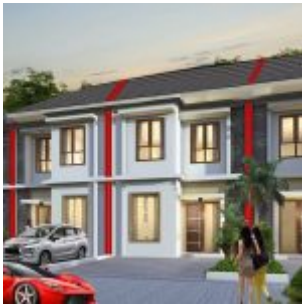
Rumah Kaisar Serpong