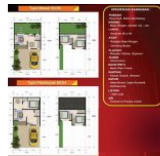
Spesifikasi Bangunan Rumah Kaisar Serpong

Price List harga jual rumah Kaisar Serpong saat Pre – Launching adalah: