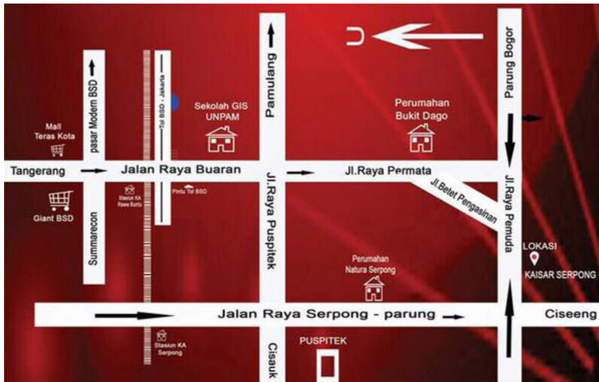
Peta Lokasi Rumah Kaisar Serpong

Lokasi strategis dekat jalan utama membuat perumahan Kaisar Serpong potensial untuk dijadikan hunian idaman ataupun investasi properti terbaru tahun ini.