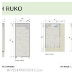
Denah Ruko Pasmod Graharaya 01

Harga jual ruko Graharaya mulai daripada Rp. 1,6 miliaran.