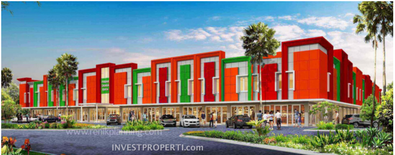
Ruko Pasar Modern Graharaya

Pasmod Graharaya dihadirkan dengan konsep pasar yang bersih, segar dan nyaman. Fasilitas lengkap dan tertata sesuai dengan zonasi diterapkan guna memberikan kenyamanan kepada pengunjung pasar modern Graharaya dalam berbelanja sesuai kebutuhan.