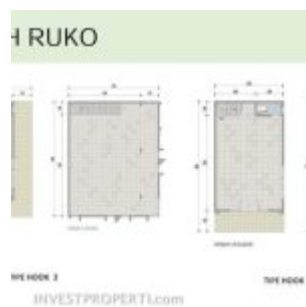
Denah Ruko Pasmod Graharaya 02

Tipe Kios Pasmod GrahaRaya dijual dengan pilihan: