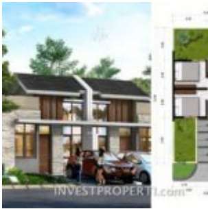
Tipe L6 Cluster Portofino Villaggio Citra Raya