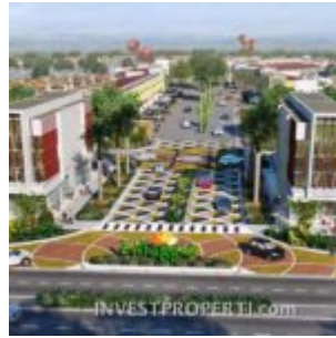
Gate Cluster Villaggio Citra Raya