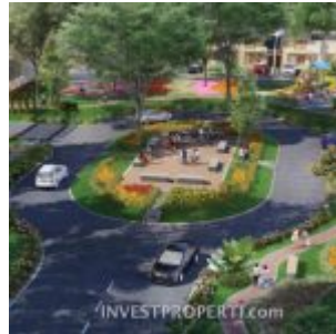
Suasana Cluster Portofino CitraRaya