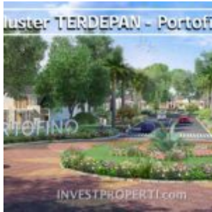
Cluster Portofino Villaggio CitraRaya