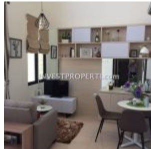
Interior Design Rumah Villaggio CitraRaya