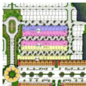
Site Plan Cluster Portofino Villaggio Citra Raya