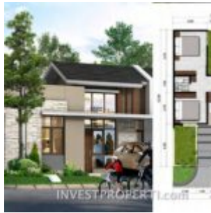
Tipe L7 Cluster Portofino Villaggio Citra Raya