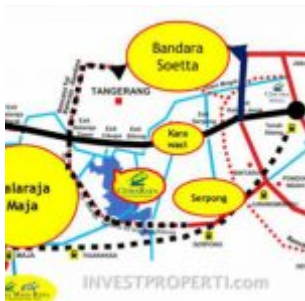
Peta Lokasi Citra Raya