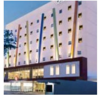
Amaris Hotel CitraRaya