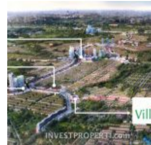
Lokasi Cluster Villaggio Citra Raya

Area perumahan Villaggio dekat dengan Gardenville dan dekat dengan Mall Ciputra Cikupa. Lokasi cluster Villaggio juga tidak jauh dari area Ecopolis, sebuah kawasan hunian terpadu seluas 1000 hektar yang memenuhi semua kebutuhan dan fungsi sebuah kota mandiri dengan adanya pusat perbelanjaan, plaza, kawasan komersial, pusat hiburan, dll.