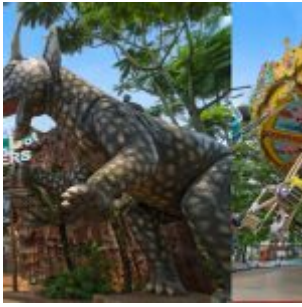
World Of Wonders Citra Raya