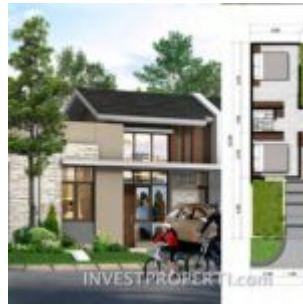
Tipe L7 Cluster Portofino Villaggio Citra Raya