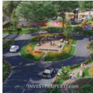
Suasana Cluster Portofino CitraRaya