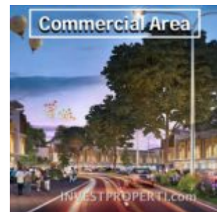
Commercial Area Cluster Villaggio