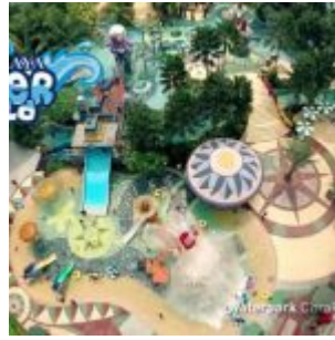
Citraraya Water World