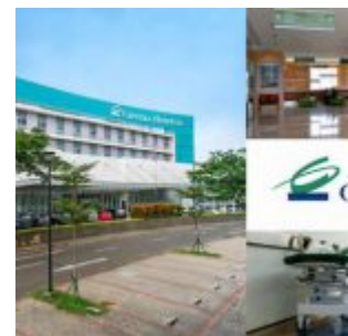
Ciputra Hospital Citra Raya