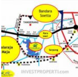
Peta Lokasi Citra Raya