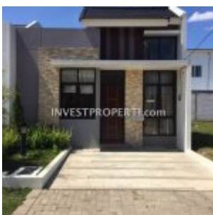
Show Unit Rumah

Ingin melihat foto show unit rumah di Villaggio Citraraya Tangerang atau melihat sendiri bagaimana penampakan aktualnya? Ga sempat mengunjungi secara langsung rumah contoh Villaggio CitraRaya ? Tidak masalah, berikut adalah beberapa foto show unit rumah cluster Villaggio yang diambil langsung dari lokasi.