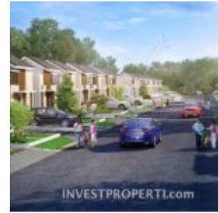
Rumah Cluster Portofino CitraRaya