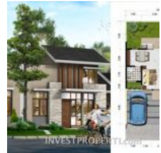
Tipe L8 Cluster Portofino Villaggio Citra Raya