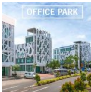
Office Park Citra Raya