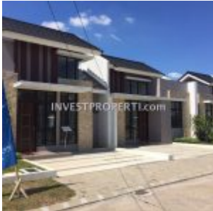
Foto Show Unit Cluster Villaggio Citraraya