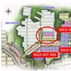
Site Plan Cluster Villaggio Citra Raya