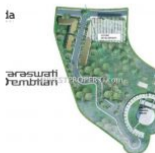
Site Plan Ruko Saraswati 9