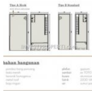
Tipe Ruko Pasar Anyar Vida Bekasi