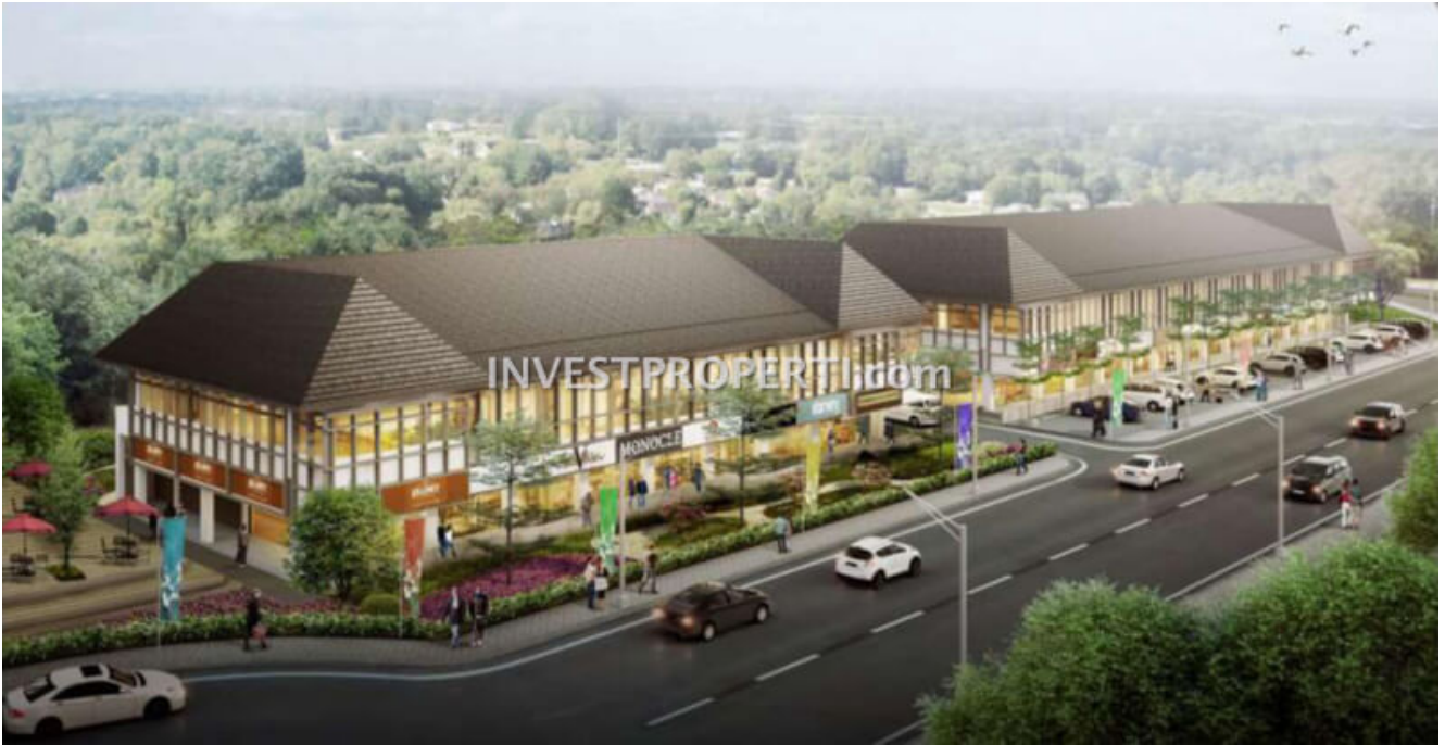
Ruko Saraswati 9 Vida Bekasi

Ruko terbaru Vida Bekasi ini merupakan kompleks ruko modern dengan lokasi yang terintegrasi dengan BINUS School, yang dihubungkan dengan koridor pejalan kaki. Dengan arsitektur modern dan konsep loft, ruko Saraswati Sembilan berlokasi di jalur utama Vida Bekasi.