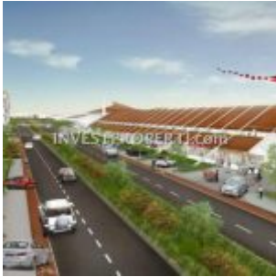
Ruko Pasar Anyar Vida Bekasi