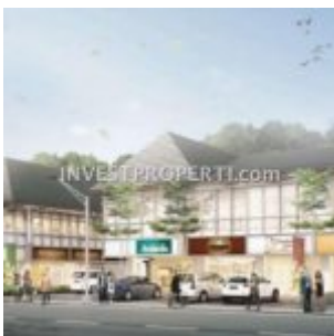
Ruko Saraswati 9 Vida Bekasi

Ruko terbaru Vida Bekasi ini merupakan kompleks ruko modern dengan lokasi yang terintegrasi dengan BINUS School, yang dihubungkan dengan koridor pejalan kaki. Dengan arsitektur modern dan konsep loft, ruko Saraswati Sembilan berlokasi di jalur utama Vida Bekasi.