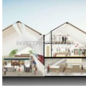
Ruko Pasar Anyar Vida Bekasi

Pemilik usaha yang ingin mengembangkan sayap usaha dapat melihat ruko Pasar Anyar Vida Bekasi . Memiliki lokasi terbaik dengan pangsa pasar luar dimana terletak di jalur utama Vida Bekasi.