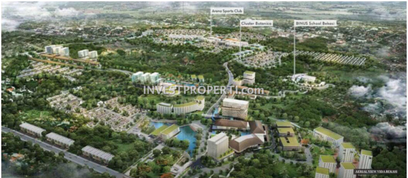
Vida Bekasi Aerial View

Launching ruko terbaru di Vida Bekasi 2017 dengan ruko Pasar Anyar dan ruko Saraswati Sembilan. Dijual perdana, ruko Vida Bekasi dengan harga jual mulai dari Rp. 900 jutaan oleh developer Gunas Land .