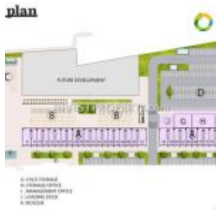
Site Plan Ruko Pasar Anyar Vida Bekasi