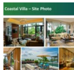
Coastal Villas Forest City Johor Interior Design

Memiliki luas sekitar 4000-5000 square feet, dengan 2-3 level Marina Villas, rumah cluster, semi-detached bungalows yang dikelilingi oleh bank taman dan ditambah dengan pemandangan laut yang indah. Space untuk Lift pribadi disediakan bagi pemilik yang ingin memasangnya. Pilihan tipe bangunan mulai daripada 278 m2 hingga 609 m2 tersedia.