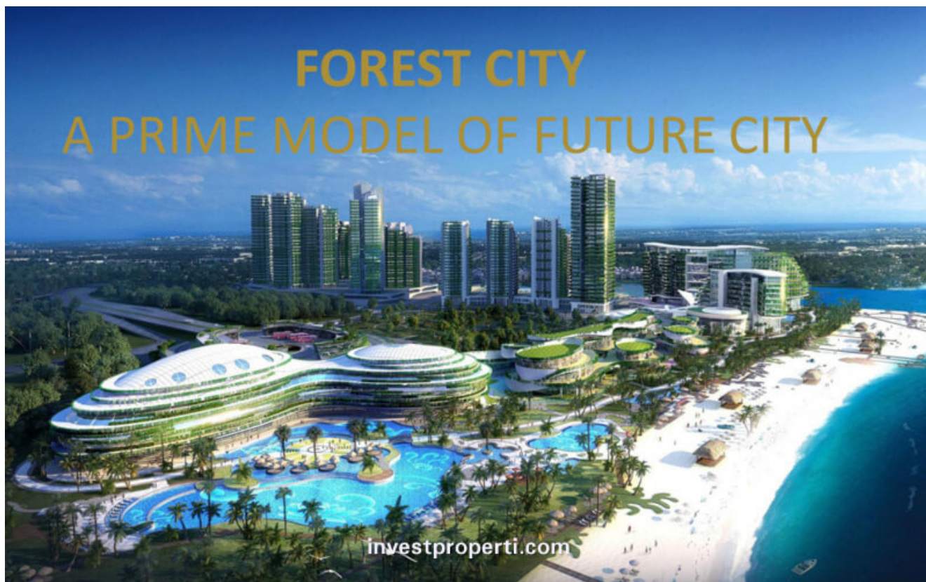
Forest City Johor

Forest City Johor Country Garden PacificView , sebuah projek joint venture antara Country Garden dan Esplanade Danga 88 di Johor, Malaysia. Lokasi Forest City adalah strategis di Johor, dimana sangat dekat dengan Singapore, berjarak sekitar 2 km.