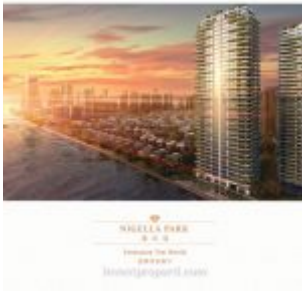
Forest City Johor Apartment