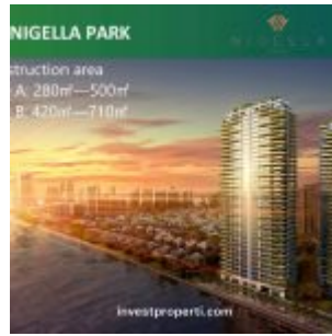
Forest City Johor Apartment – Nigella Park