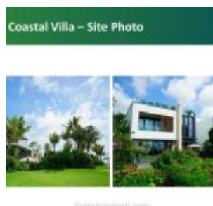
Coastal Villas Forest City Johor Unit