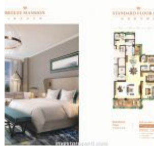
Forest City Johor Apartment Nigella Park Type A2