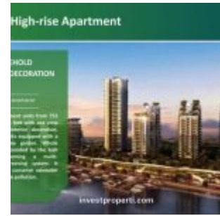
Forest City Johor Apartemen