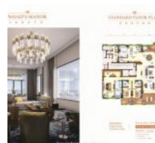
Forest City Johor Apartment Nigella Park Type B2

Miliki segera apartemen baru di Johor, Malaysia dengan menghubungi sales marketing Forest City Johor di Indonesia.