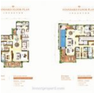
Forest City Johor Apartment Nigella Park Floor Plan