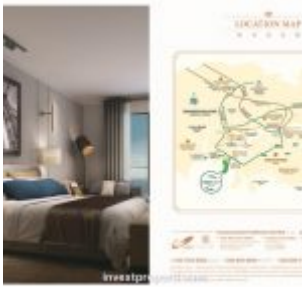
Forest City Johor Apartment Nigella Park Map Location