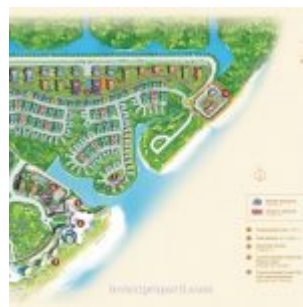
Forest City Johor Apartment Nigella Park Location