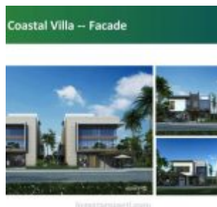
Coastal Villas Forest City