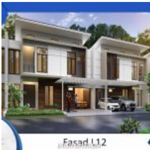
Rumah Cluster Shinano Tipe L12