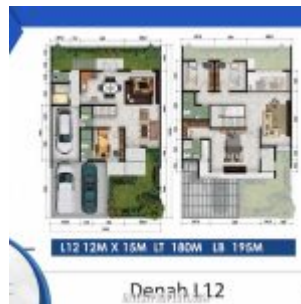
Denah Rumah Cluster Shinano Tipe L12