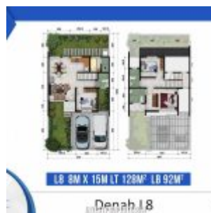
Denah Rumah Cluster Shinano Tipe L8