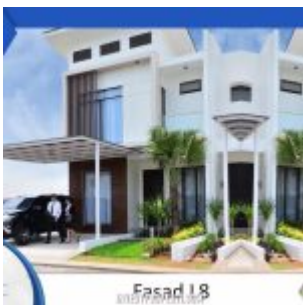
Rumah Cluster Shinano Tipe L8