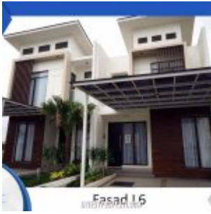
Rumah Cluster Shinano Tipe L6