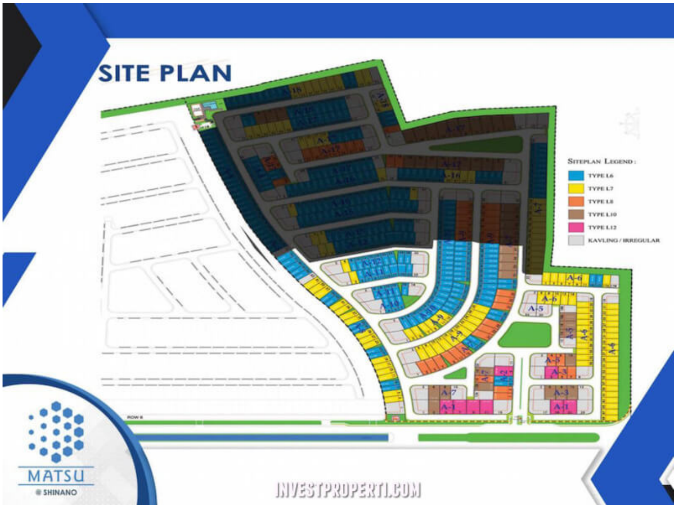
Site Plan Cluster Shinano