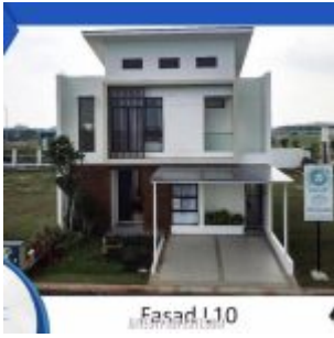
Rumah Cluster Shinano Tipe L10