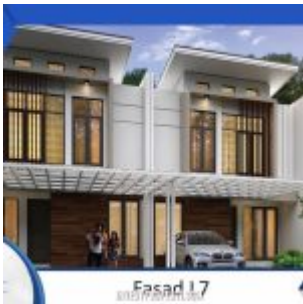
Rumah Cluster Shinano Tipe L7