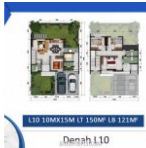
Denah Rumah Cluster Shinano Tipe L10