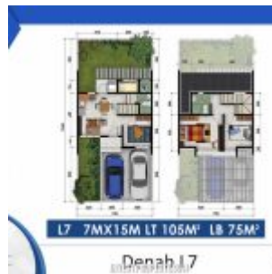
Denah Rumah Cluster Shinano Tipe L7