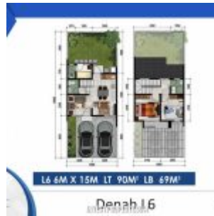
Denah Rumah Cluster Shinano Tipe L6