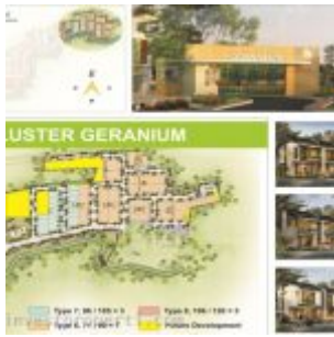
Master Plan Cluster Geranium