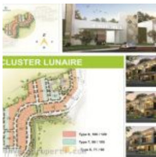
Master Plan Cluster Lunaire

Price list harga rumah cluster Lunaire ini adalah mulai daripada Rp. 1,6 miliaran.