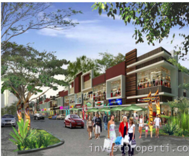
Ruko La Verde Serpong Park