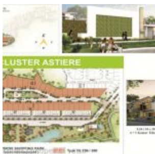
Master Plan Cluster Astiere

Harga jual rumah cluster Astiere adalah mulai daripada Rp. 3,1 miliaran.