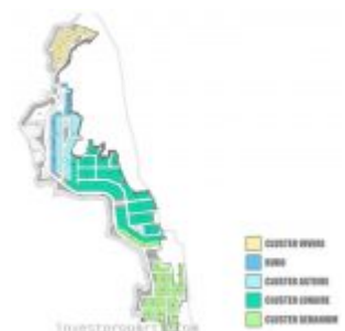
Site Plan La Verde Serpong Park