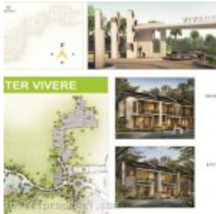
Master Plan Cluster Vivere

Harga jual rumah cluster Vivere mulai daripada Rp. 1,2 miliaran.