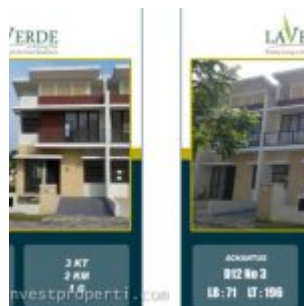
Dijual Rumah La Verde Serpong Park