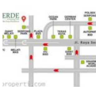
Peta Lokasi Laverde Serpong Park

Lokasi La Verde berada di kawasan Serpong Park, tepat di belakang BSD Plaza dan setelah Melati Mas Residence. Akses yang mudah ditawarkan menuju La Verde Serpong Park, dimana dapat melalui tol Alam Sutera dan BSD, juga sangat dekat dengan stasiun KA Rawa Buntu. Ditambah dengan akan beroperasinya exit tol baru Kunciran – Serpong, yang berjarak hanya +/- 500 m dari gate LA VERDE, memberikan jaminan nilai investasi kawasan yang akan meningkat pesat.