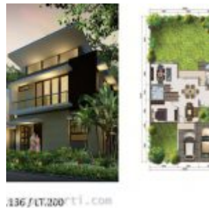
Rumah Cluster Astiere