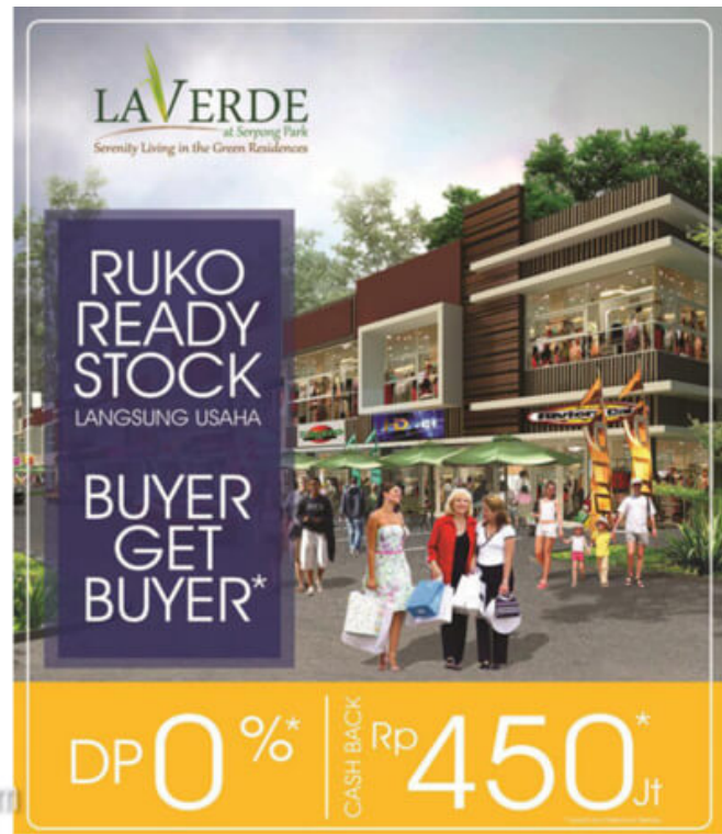
Promo La Verde Serpong Park

Lokasi La Verde berada di kawasan Serpong Park, tepat di belakang BSD Plaza dan setelah Melati Mas Residence. Akses yang mudah ditawarkan menuju La Verde Serpong Park, dimana dapat melalui tol Alam Sutera dan BSD, juga sangat dekat dengan stasiun KA Rawa Buntu. Ditambah dengan akan beroperasinya exit tol baru Kunciran – Serpong, yang berjarak hanya +/- 500 m dari gate LA VERDE, memberikan jaminan nilai investasi kawasan yang akan meningkat pesat.