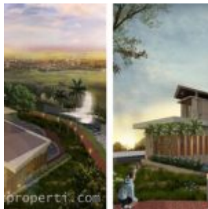
Club House La Verde Serpong Park

Kawasan perumahan cluster LA VERDE dilengkapi dengan berbagai macam fasilitas internal untuk kenyamanan penghuni cluster, sebut saja seperti club house, swimming pool, fitness centre, children playground, lake and park, dll.