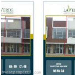
Dijual Ruko La Verde Serpong Park

Untuk rumah cluster, konsumen dapat membeli dengan DP 0%* , sedangkan untuk ruko La Verde, pembeli dapat membeli ruko ready stock langsung usaha dengan promo buyer get buyer *, DP 0% ditambah program cashback hingga Rp. 450 juta*.