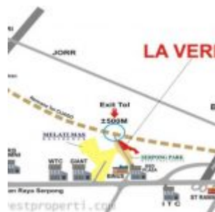
Lokasi La Verde Serpong Park