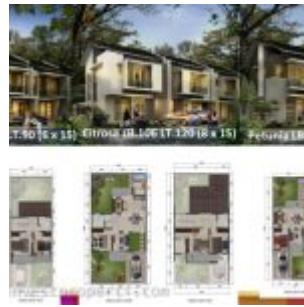
Rumah Cluster Geranium