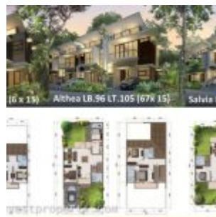
Rumah Cluster Lunaire