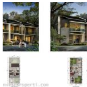
Rumah Cluster Vivere