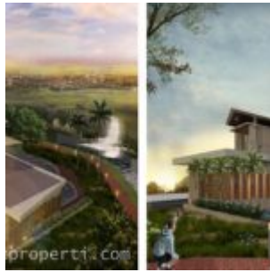
Club House La Verde Serpong Park

Kawasan perumahan cluster LA VERDE dilengkapi dengan berbagai macam fasilitas internal untuk kenyamanan penghuni cluster, sebut saja seperti club house, swimming pool, fitness centre, children playground, lake and park, dll.