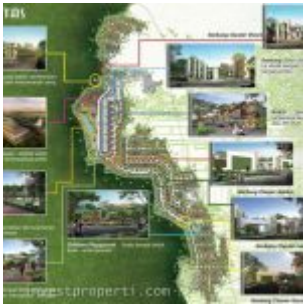
Fasilitas La Verde Serpong Park