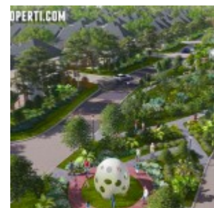
The Mozia BSD Cluster Amarine

Dijual perdana rumah cluster Amarine memiliki 2 pilihan tampak depan dengan 2 lantai. Terdapat 2 pilihan luasan pada fase ke-2 ini sebagai berikut: