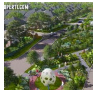
The Mozia BSD Cluster Amarine

Dijual perdana rumah cluster Amarine memiliki 2 pilihan tampak depan dengan 2 lantai. Terdapat 2 pilihan luasan pada fase ke-2 ini sebagai berikut: