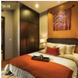
Design Master Bed Rumah Amarine The Mozia