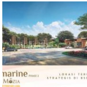
Rumah Amarine @ The Mozia BSD