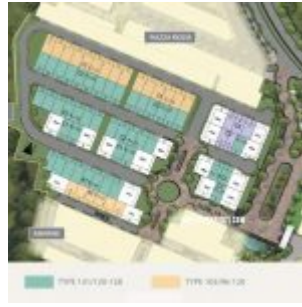
Site Plan Amarine BSD Fase 2