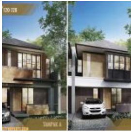
Rumah Amarine Tipe 131