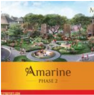
Cluster Amarine Tahap 2

Sinarmas Land membuka penjualan perdana cluster perumahan terbaru di kawasan The Mozia BSD dengan cluster AMARINE tahap ke-2 . Kawasan The Mozia adalah area pengembangan terbaru seluas 16,7 hektar dimana memiliki konsep lifestyle baru yang memberikan kelengkapan akomodasi dan fasilitas retail yang menyesuaikan kebutuhan kehidupan urban. The Mozia merupakan “world class development” di BSD CITY.