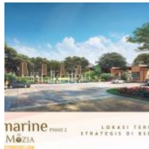
Rumah Amarine @ The Mozia BSD