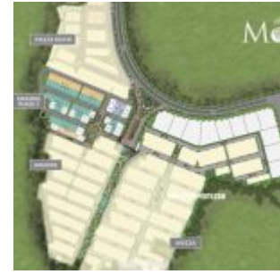
Site Plan Amarine BSD Fase 2

Cluster Amarine diapit oleh kawasan Piazza Mozia dan cluster perumahan pertama The Mozia, cluster Avezza . Menuju ke Sport Club seluas 3,7 hektar juga sangat dekat.