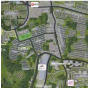
Peta Lokasi Amarine BSD Fase 2