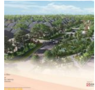
Perumahan Amarine Mozia BSD

Memiliki lokasi terbaik dan strategis di BSD City, The Mozia sangat dekat dengan mix commercial area BSD City, dimana terdapat komplek ruko Piazza Mozia , rumah kos Piazza Mozia , ICE BSD City, AEON Mall, QBIG dan lainnya. Kawasan The Mozia juga dekat dengan EDU TOWN BSD, dimana terdapat Prasetia Mulya University, SGU, Atmajaya.