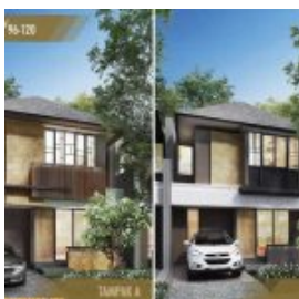
Rumah Cluster Amarine