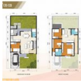
Denah Rumah Amarine Tipe 131