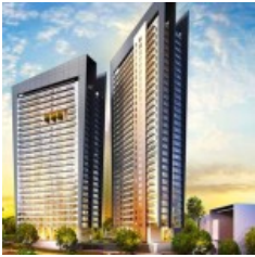
Apartemen Casa De Parco Bsd City