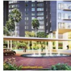
Loby Apartemen Casa de Parco