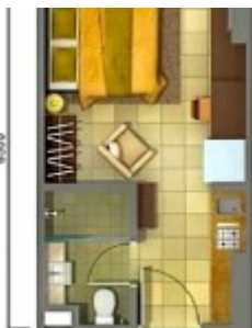
Unit Plan Studio Tower Orchidea