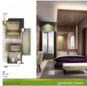
Tipe Unit Studio Corner