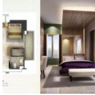
Tipe Studio Corner – Casa de Parco