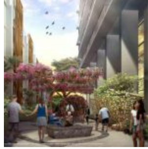
Gardenia Eco Park Casa de Parco