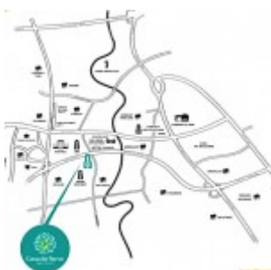
Peta Lokasi Casa

Dekat dengan apartemen Saveria , kawasan perumahan cluster Foresta, The Icon dan The Avani, menjadikan apartemen Casa de Parco salah satu pilihan investasi apartemen pilihan terbaik di BSD City. Casa de Parco dekat dengan CBD BSD, pusat perkantoran BSD Green Office Park, Lifestyle & Entertainment The Breeze, Foresta Business Loft, area CBD Sunburst, ICE BSD, AEON Mall, SGU dan Prasetiya Mulya Business School, Jakarta Nanyang School, Teraskota, dll.