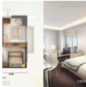
Tipe Unit Loft C – Casa de Parco

5. Tipe Studio , luas semigross : 27,59 m 2 dan Nett 22,89 m 2 ,