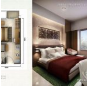
Tipe Studio – Casa de Parco