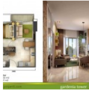
Tipe Unit 1 Kamar