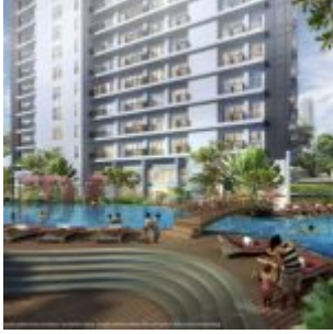
Swimming Pool Casa de Parco