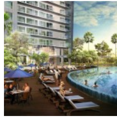
Casa de Parco Apartmen t Pool