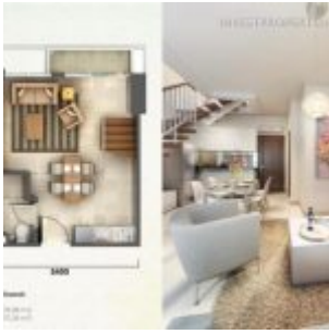
Tipe Loft 3 Bawah – Casa de Parco

3. Tipe LOFT 3 , luas semigross : 78.08 m 2 ; Nett: 70.34 m 2 .