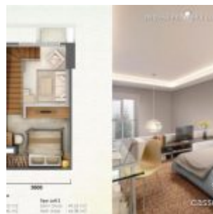
Tipe Unit Loft 2 Casa de Parco