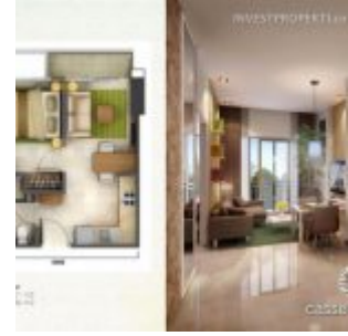
Tipe 1 BR – Casa de Parco