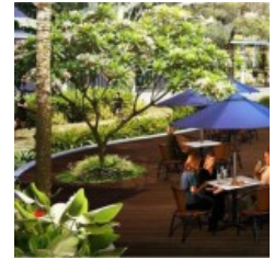
Taman Casa de Parco BSD Apartmen t