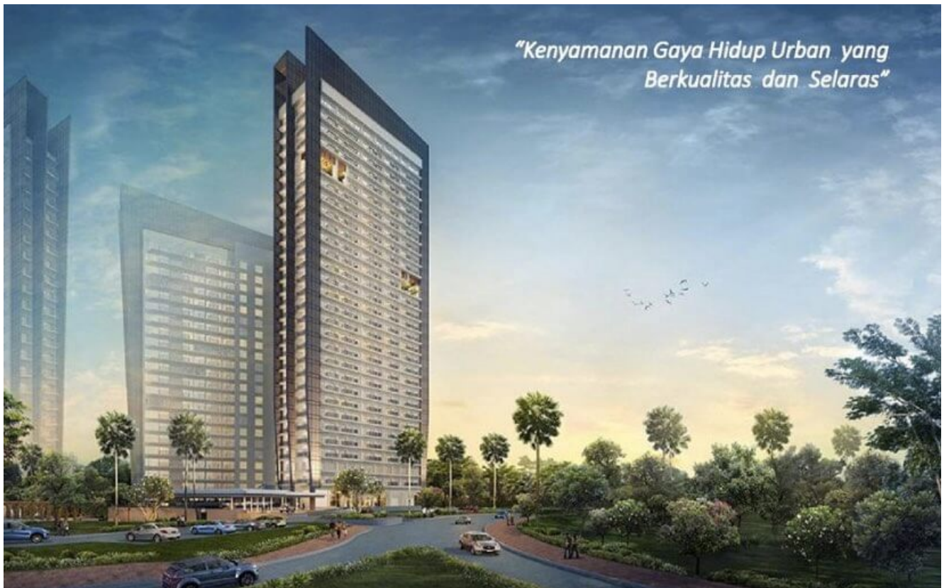
Casa de Parco BSD Apartment

Apartemen Casa de Parco merupakan apartemen baru di BSD City persembahkan dari Sinar Mas Land setelah sukses dengan penjualan apartemen Saveria BSD . Casa de Parco adalah proyek baru Sinar Mas Land dengan luas area 2,1 hektar. Konsep pembangunan apartemen di BSD City ini adalah hunian bernuansa hijau, dimana adalah hunian bertingkat yang akan berintegrasi dengan ruang hijau di sekitarnya.