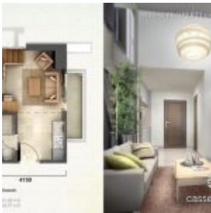
Tipe Unit Loft C – Casa de Parco

4. Tipe LOFT C , luas semigross : 51.03 m 2 ; Nett: 45.97 m 2 .