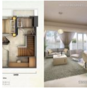
Tipe Loft 3 Atas – Casa de Parco

4. Tipe LOFT C , luas semigross : 51.03 m 2 ; Nett: 45.97 m 2 .