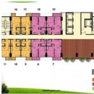
Floorplan Tower Orchidea Lantai 22-23