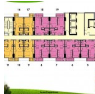
Floorplan Tower Orchidea Apartemen Casa De Parco

Tipe unit Casa de Parco apartment tower Orchidea meliputi :