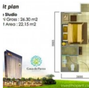
Tipe Studio Tower Magnolia