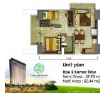
Tipe 2 Bedroom Tower Magnolia