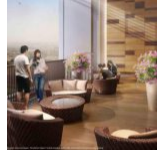
Sky Lounge Casa de Parco

Fasilitas lingkungan sekitar Casa de Parco sangat lengkap mulai dari :