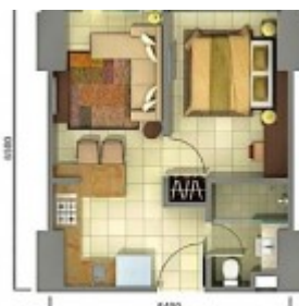
Tipe 1 Kamar Tidur Unit Plan Tipe 1BR Tower Orchidea