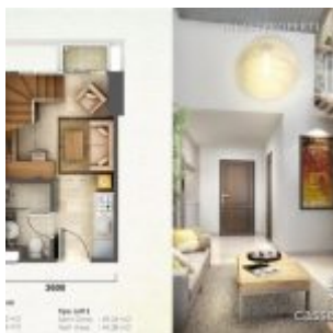
Tipe Unit Loft 1 Casa de Parco