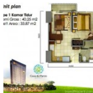
Tipe 1 Bedroom Tower Magnolia