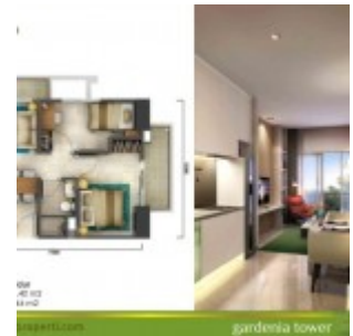
Tipe Unit 2 Kamar