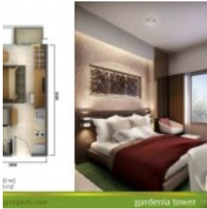
Tipe Unit Studio