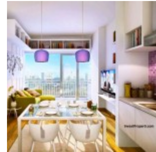
Interior Design 2BR Casa de Parco Bsd