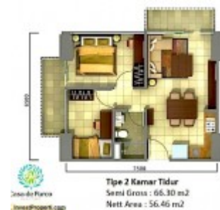
Unit Plan Tipe 2BR Tower Orchidea