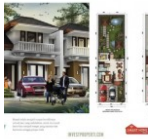
Cluster Frisea Tipe 161

Cara bayar yang beragam dan super ringan ditawarkan untuk mengikuti kemampuan keuangan pembeli rumah dengan pilihan :