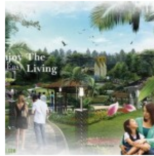
Jungle Tracking Botnica Valley Serpong