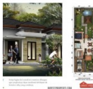
Cluster Ludisia Tipe 114