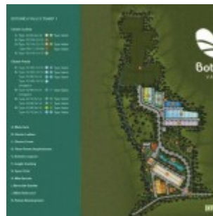
Master Plan Botanica Valley Serpong