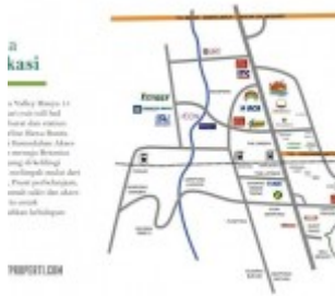
Peta Lokasi Botanica Valley Serpong

Peta lokasi Botanica Valley Serpong di Google Map :