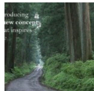
Rumah Botanica Valley Serpong