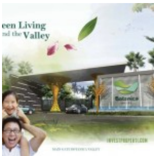
Main Gate Botanica Valley Serpong