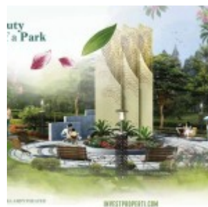
Tower Amphytheater Botanica Valley Serpong