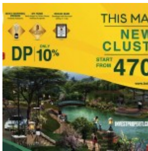
Brosur Terbaru Botanica Valley Serpong

Botanica Valley , sebuah perumahan baru di Serpong, Tangerang Selatan dengan konsep baru yang menggabungkan konsep alam dengan kehidupan kaum urban. Persembahan terbaru dari PT Surya Agung Realti. Harga jual perdana rumah Botanica Valley Serpong ini mulai daripada Rp 470 jutaan (tahap 2 bulan Maret-2015 ini).