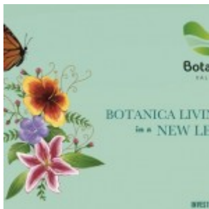
Brosur Botanica Valley Serpong