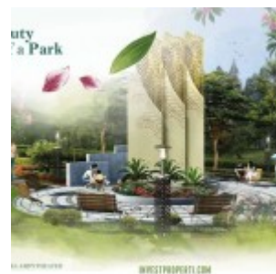
Tower Amphytheater Botanica Valley Serpong