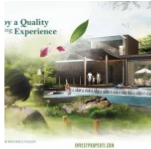
Club House Botnica Valley Serpong