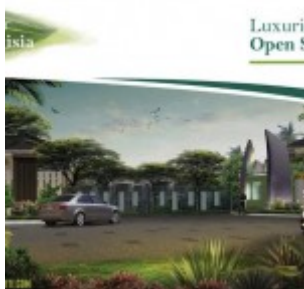
Cluster Ludisia Botnica Valley Serpong