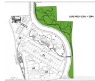
Master Block Cluster Ludisia Botanica Valley Serpong