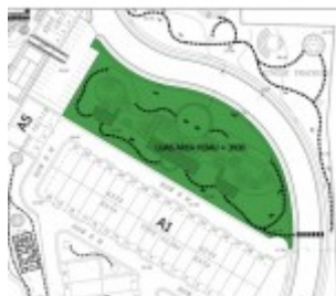
Master Block Cluster Ludisia Botanica Valley Serpong