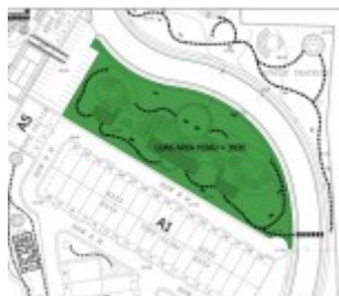
Master Block Cluster Ludisia Botanica Valley Serpong