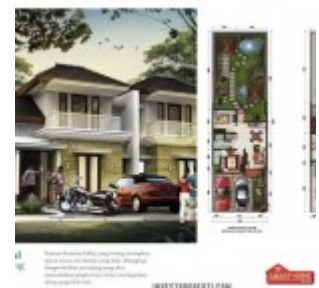
Cluster Ludisia Tipe 161