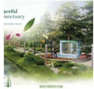
Riverside Garden Botnica Valley

Saat ini cluster rumah Botnica Valley Tahap 1 dibuka dengan penjualan 2 cluster sebagai berikut :