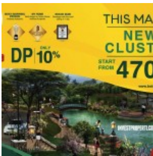
Brosur Terbaru Botanica Valley Serpong

Botanica Valley , sebuah perumahan baru di Serpong, Tangerang Selatan dengan konsep baru yang menggabungkan konsep alam dengan kehidupan kaum urban. Persembahkan terbaru dari PT Surya Agung Realti. Harga jual perdana rumah Botanica Valley Serpong ini mulai daripada Rp 470 jutaan (tahap 2 bulan Maret-2015 ini).