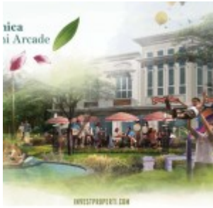
Botnica Valley Mini Arcade