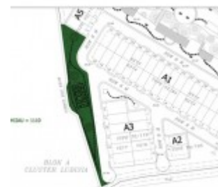
Master Block Cluster Ludisia Botanica Valley Serpong