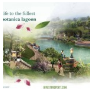
Botanica Valley Lagoon Serpong