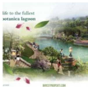
Botanica Valley Lagoon Serpong