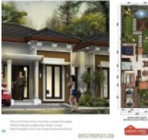
Cluster Frisea Tipe 114