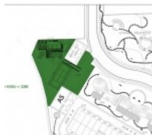
Master Block Cluster Ludisia Botanica Valley Serpong