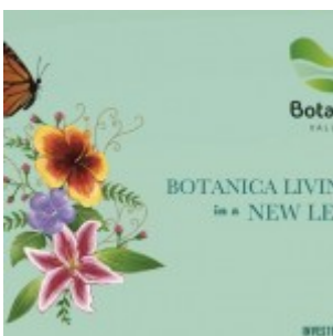
Brosur Botanica Valley Serpong