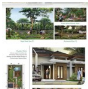
Perumahan Botanica Valley Serpong