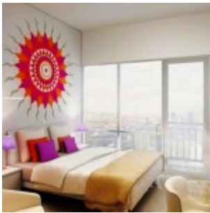
Interior Design Studio Casa de Parco Bsd