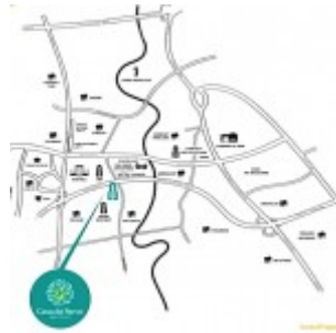
Peta Lokasi Casa De Parco Bsd City

Design apartemen Casa de Parco adalah modern unit dengan memadukan aspek lingkungan hijau yang sari. Dengan total 4 tower apartment, Casa de Parco akan mempunyai pintu masuk entrance di 4 sisi kawasan, fasilitas courtyard yang luas dan hijau, dengan ruang terbuka yang luas di setiap unit tower bangunannya. Untuk memudahkan akses kepada para penghuni apartment, setiap tower akan saling terhubung satu sama lainnya.