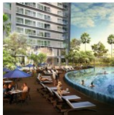
Casa de Parco Apartemen t Pool