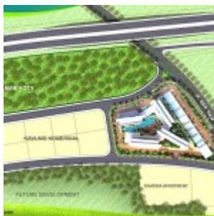
Site Plan Casa De Parco Bsd City