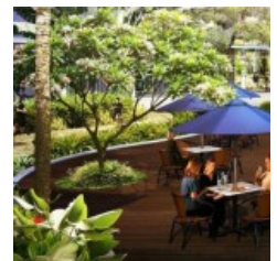
Taman Casa de Parco BSD Apartemen t

Lokasi Casa de Parco apartment sangat strategis, yakni di dalam kawasan komersial Taman Kota Barat yang paling depan. Dekat dengan apartemen Saveria , kawasan perumahan cluster Foresta, The Icon dan The Avani, menjadikan apartemen Casa de Parco salah satu pilihan investasi apartemen pilihan di BSD City.