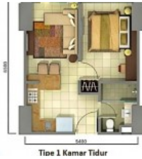
Unit Plan Tipe 1BR Tower Orchidea