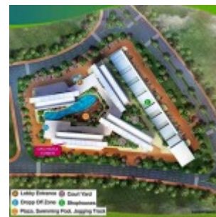
Block Plan Casa De Parco Bsd City