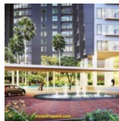
Loby Apartemen Casa de Parco