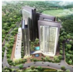
Casa De Parco Apartemen t Bsd City