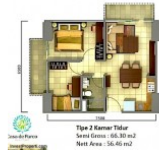
Unit Plan Tipe 2BR Tower Orchidea