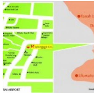
Swiss Belhotel Kuta Condotel Bali Map

Lokasi Swiss-Belhotel Kuta condotel Bali sangat prime, hanya 2.5 km ke pantai Kuta, dan berjarak hanya 1 km / 5 menit ke bandara Ngurah Rai. Sekitar kondotel dikelilingi oleh fasilitas 2x lengkap seperti duty free shopping center, Discovery Mall dan Water Boom Bali.