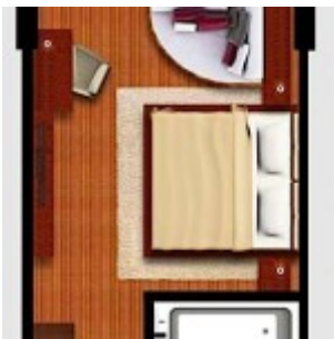
Tipe Kamar Deluxe