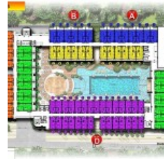
Lantai 3 Site Plan