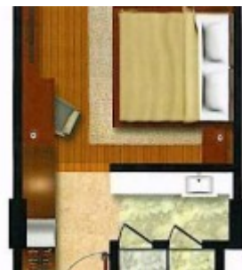
Tipe Kamar Deluxe Standard Pool View