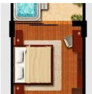
Tipe Kamar Deluxe