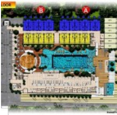
Ground Floor Site Plan