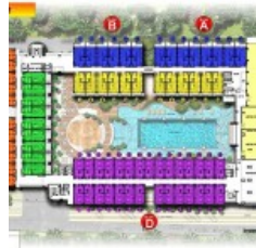
Lantai 2 Site Plan