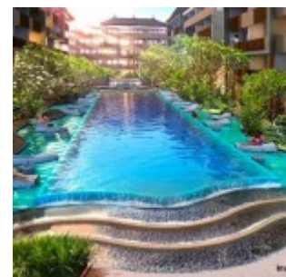
Pool Swiss-Belhotel Kuta Bali