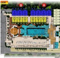
Ground Floor Site Plan