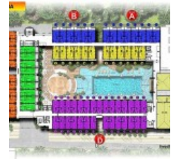
Lantai 3A Site Plan

Condotel Swiss-BelHotel Kuta Bali dijual dengan beberapa pilihan tipe kamar sbb: