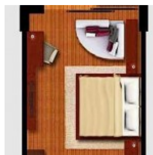
Tipe Kamar Deluxe