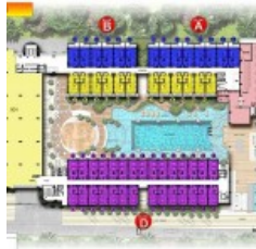
Lantai 1 Site Plan