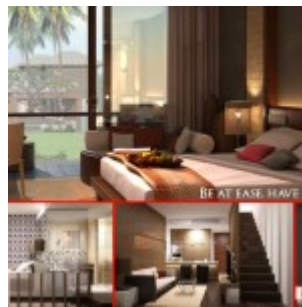
Design Swiss-Belhotel Kuta