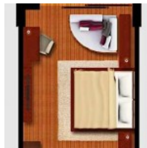
Tipe Kamar Deluxe Garden