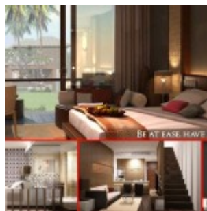
Design Swiss-Belhotel Kuta