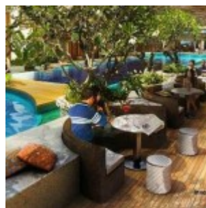
Teras Resto Swiss-Belhotel