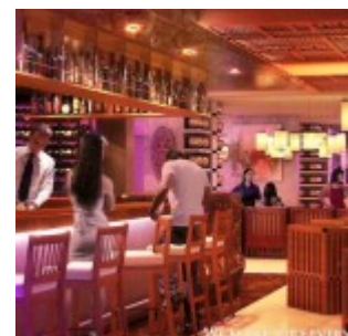
Restoran Swiss-Belhotel Kuta