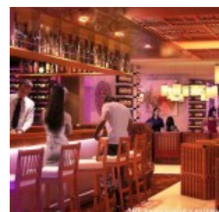
Restoran Swiss-Belhotel Kuta