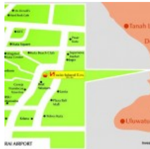
Swiss Belhotel Kuta Condotel Bali Map

Lokasi Swiss-Belhotel Kuta condotel Bali sangat prime, hanya 2.5 km ke pantai Kuta, dan berjarak hanya 1 km / 5 menit ke bandara Ngurah Rai. Sekitar kondotel dikelilingi oleh fasilitas 2x lengkap seperti duty free shopping center, Discovery Mall dan Water Boom Bali.