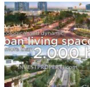
Citra Maja Raya

Citra Maja Raya merupakan kawasan kota terpadu dengan konsep Transit Oriented Development (TOD) dimana terdapat Stasiun Maja yang adalah berfungsi sebagai simpul transportasi (HUB). Lokasi Maja saat ini sudah tersambung dengan jalur Double Track dan kereta api Commuter Line.