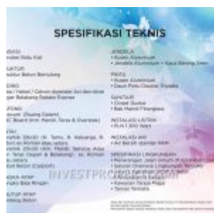
Spesifikasi Rumah RE Citra Maja