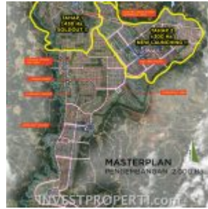
Master Plan Citra Maja Raya 2

Bulan November 2016 ini akan segera dilaunching 2 cluster terbaru Citra Maja Raya 2.