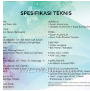
Spesifikasi Rumah RS Citra Maja Raya 2

Tipe rumah Realestate RE Citra Maja Raya 2 dijual perdana Cluster NAVINA , dengan tipe unit: