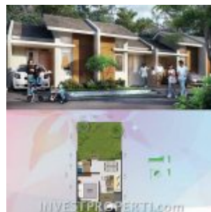
RS Citra Maja Raya 2 Tipe L5