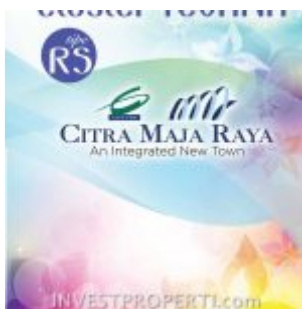
Brosur RS Tevana Citra Maja Raya 2

Soft launching penjualan rumah terbaru di kawasan dengan nama Citra Maja Raya 2 seluas 266 hektar yang adalah bagian daripada perluasan pembangunan kota baru Citra Maja Raya dengan total 2.000 hektar. Citra Maja Raya 2 akan memiliki +/- 12.000 unit rumah, komersial area dan beragam fasilitas.