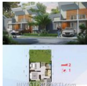
Cluster Navina RE Citra Maja Raya 2 Tipe L6