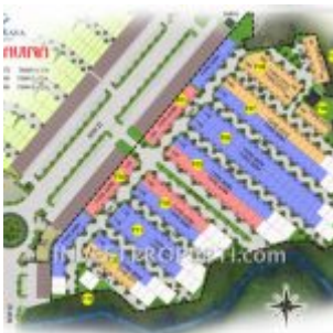
Site Plan Cluster Navina RE Citra Maja Raya 2