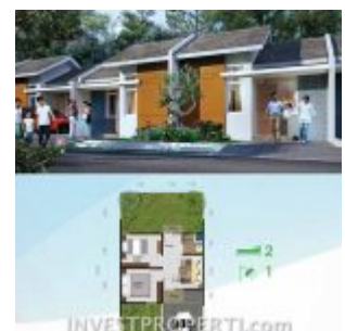
RS Citra Maja Raya 2 Tipe L6