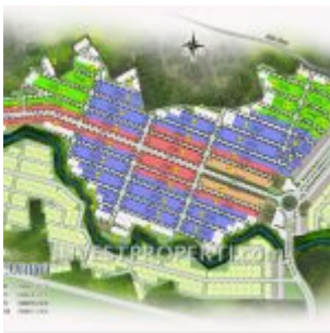
Site Plan Cluster TEVANA Rumah RS Citra Maja Raya 2