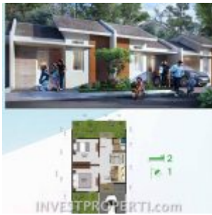
RS Citra Maja Raya 2 Tipe L7