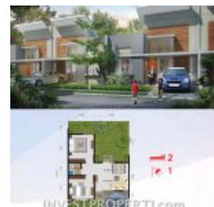
Cluster Navina RE Citra Maja Raya 2 Tipe L7