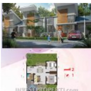
Cluster Navina RE Citra Maja Raya 2