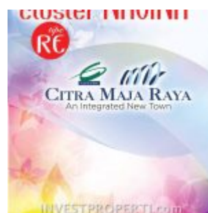
Brosur RE Navina Citra Maja Raya 2