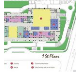
1st Floor Plan

Nama Proyek : Sentraland Cengkareng Apartment