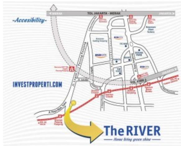
Peta Lokasi The RIVER Parung Panjang