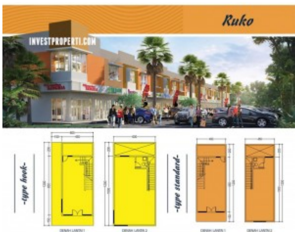
Ruko The River Parung Panjang

Terdapat juga Ruko The River dengan pilihan tipe Hook 6x12 dan tipe standard 4.5 x 12, dengan 2 lantai semuanya.