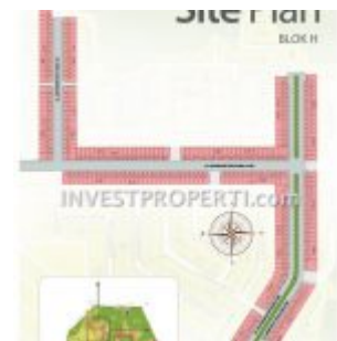
Site Plan Perumahan Sentraland Boulevard