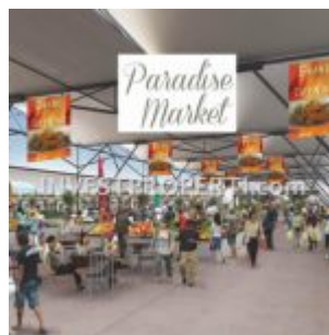
Paradise Market Parung Panjang