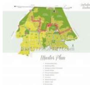
Master Plan Sentraland Boulevard