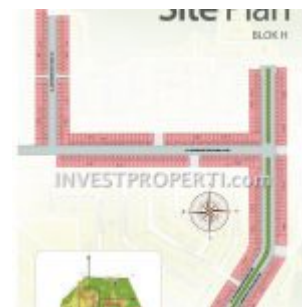
Site Plan Perumahan Sentraland Boulevard