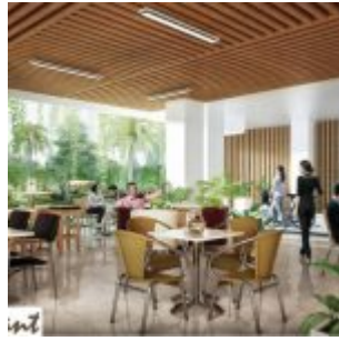
Restoran Apartemen Sentraland Cengkareng