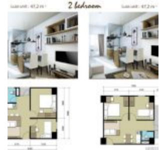
Apartemen Sentraland Cengkareng 2BR Type

Download e-brochure Sentraland Cengkareng Apartment di GoogleDrive ataupun di SlideShare .