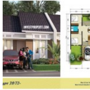
Tipe 39/72 The River