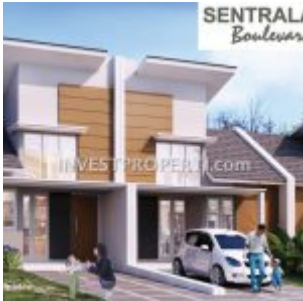
Dijual Rumah Sentraland Boulevard Parung Panjang

Pembeli sudah mendapatkan rumah dengan 2 kamar tidur dan 1 kamar mandi juga 1 carport. Terdapat area lebih dibelakang dan depan rumah yang dapat dikembangkan.