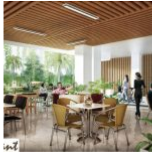
Restoran Apartemen Sentraland Cengkareng