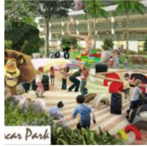
Madagascar Park – Cengkareng Sentraland Apartment