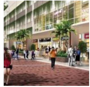
Toko Apartemen Sentraland Cengkareng