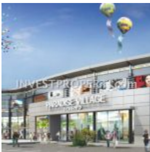
Paradise Village Parung Panjang