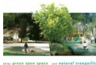
Perumahan The River