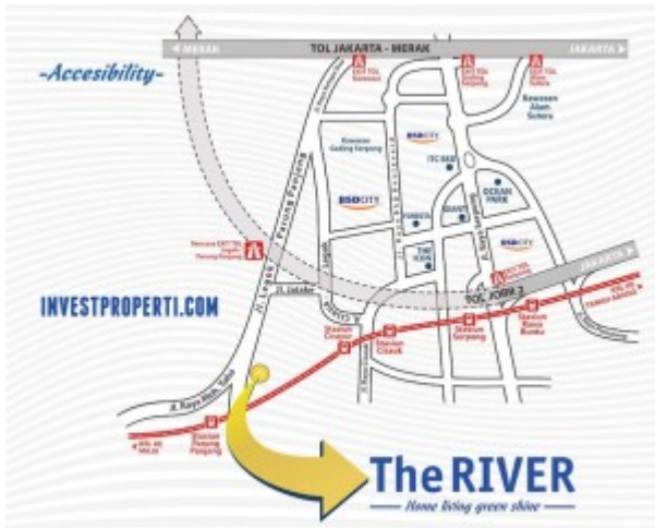
Peta Lokasi The RIVER Parung Panjang