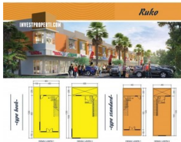
Ruko The River Parung Panjang

Terdapat juga Ruko The River dengan pilihan tipe Hook 6x12 dan tipe standard 4.5 x 12, dengan 2 lantai semuanya.