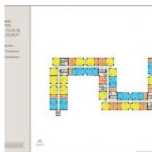
Denah Apartemen Sentraland Cengkareng

Apartemen Sentraland Cengkareng dijual dengan 3 pilihan tipe