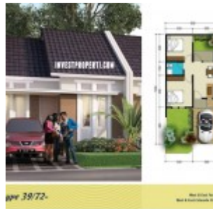
Tipe 39/72 The River