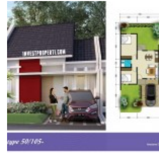
Tipe 50/105 The River

Terdapat juga Ruko The River dengan pilihan tipe Hook 6x12 dan tipe standard 4.5 x 12, dengan 2 lantai semuanya.