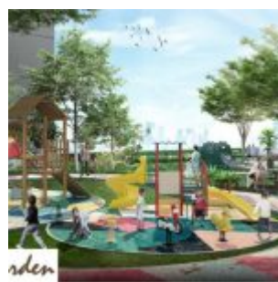
Roof Top Garden – Cengkareng Sentraland Apartment