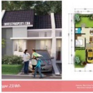
Tipe 23/60 The River