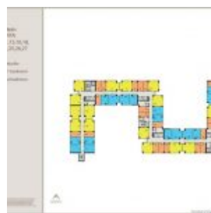
Denah Apartemen Sentraland Cengkareng

Apartemen Sentraland Cengkareng dijual dengan 3 pilihan tipe