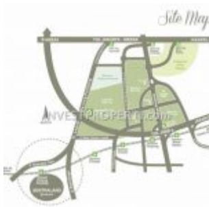
Peta Lokasi Sentraland Boulevard

Lokasi perumahan cluster Sentraland Boulevard tidak jauh dari public transport commuter line stasiun Parung Panjang. Penghuni dapat dengan mudah bermobilisasi diseluruh area JABODETABEK dengan menggunakan kereta.