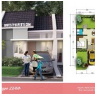
Tipe 23/60 The River