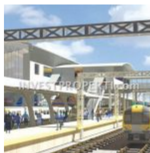
Stasiun Parung Panjang

Segara hubungi sales marketing rumah Sentraland Boulevard untuk membeli rumah baru di Parung Panjang dengan harga dibawah Rp. 500 jutaan.