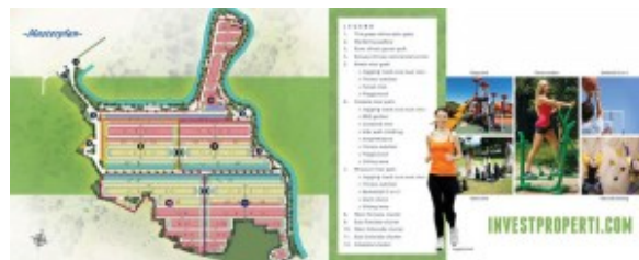
Master Plan Perumahan The River

Konsep perumahan THE RIVER Parung Panjang adalah Green Concept. Dengan thematic greenery path ditepian sungai dan berbagai taman terbuka hijau, akan memberikan suasana hunian berkualitas dengan kesejukan dan ketenangan.