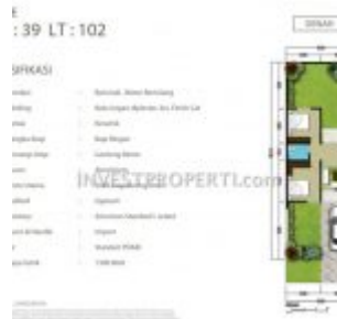
Denah Rumah Sentraland Boulevard