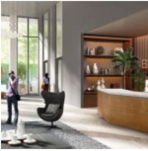
Lobby Apartemen Sentraland Cengkareng