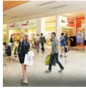
Retail Shop Sentraland Cengkareng