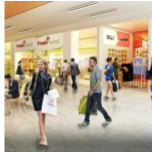
Retail Shop Sentraland Cengkareng