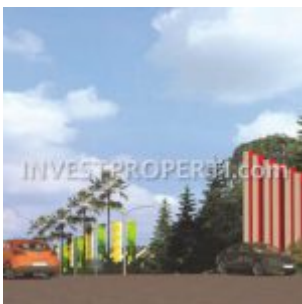
Gate Sentraland Boulevard

Sentraland Boulevard , proyek terbaru perumahan cluster Sentraland Paradise di Parung Panjang, Bogor oleh pengembang BSA Land. Launching dengan harga perdana dibawah Rp. 500 jutaan, rumah Sentraland Boulevard memiliki dual function. Hunian rumah baru Sentraland Boulevard memiliki konsep desain rumah yang memadukan kenyamanan tempat tinggal dan ruang tempat usaha yang saling mendukung.