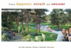
Brosur The River