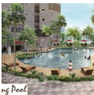
Swimming Pool – Cengkareng Sentraland Apartment