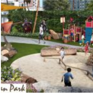
Carribbean Park – Cengkareng Sentraland Apartment