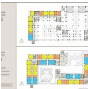
Denah Apartemen Sentraland Cengkareng