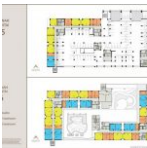
Denah Apartemen Sentraland Cengkareng