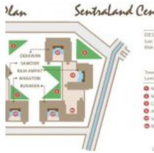
Blok Plan Apartemen Sentraland Cengkareng