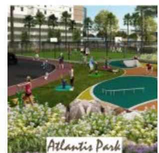
Atlantis Park – Cengkareng Sentraland Apartment