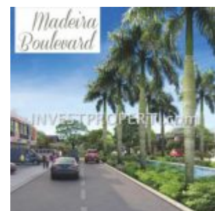
Madeira Boulevard Parung