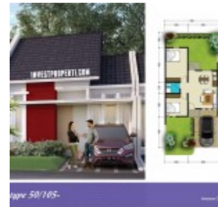
Tipe 50/105 The River

Terdapat juga Ruko The River dengan pilihan tipe Hook 6x12 dan tipe standard 4.5 x 12, dengan 2 lantai semuanya.