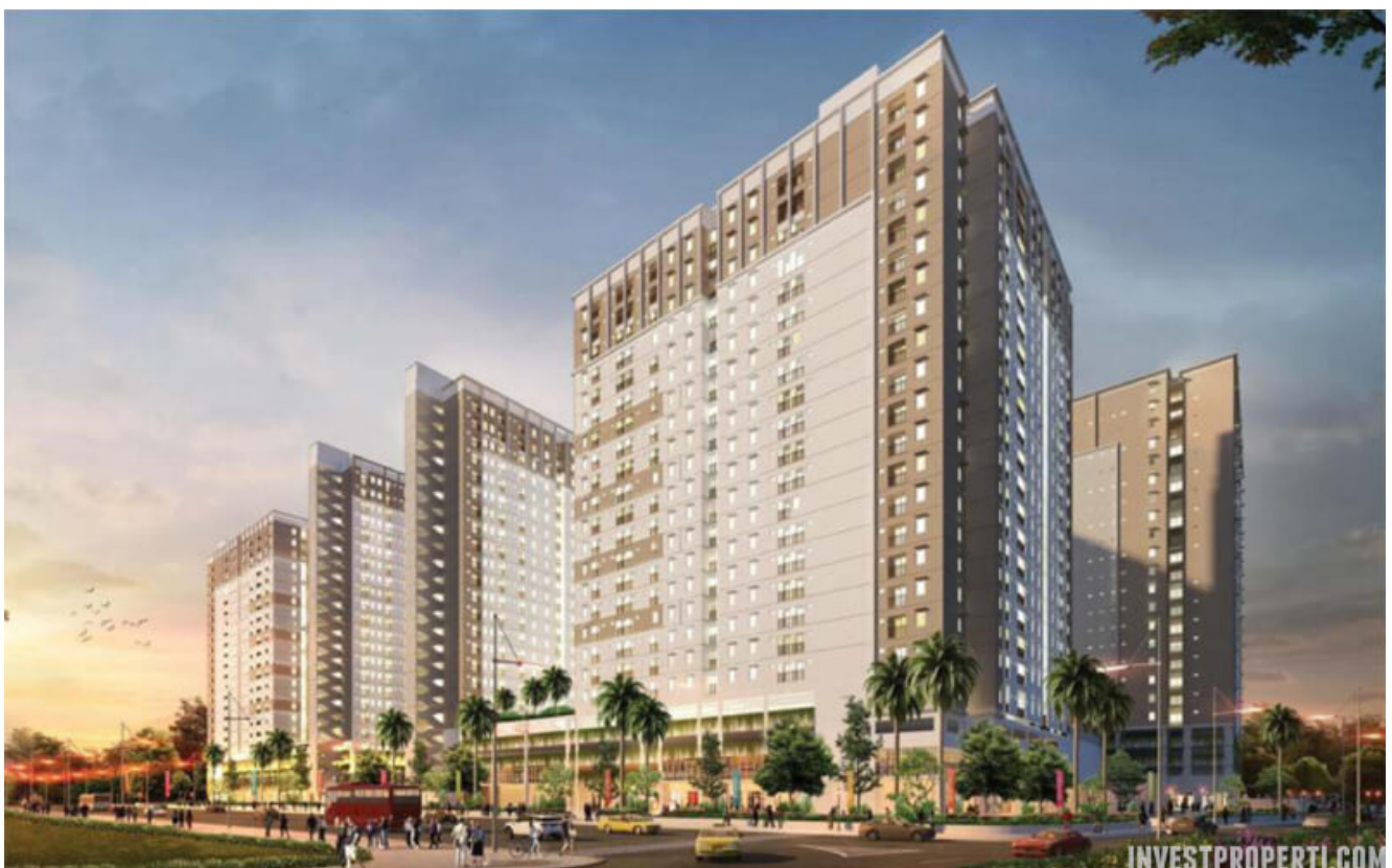
Apartemen Sentraland Cengkareng

Launching soon, Sentraland Cengkareng Apartment