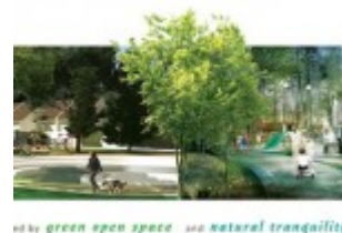
Perumahan The River