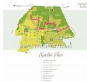
Master Plan Sentraland Boulevard