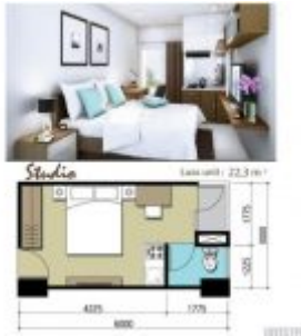
Apartemen Sentraland Cengkareng Studio Type