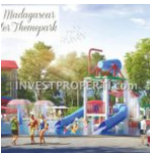
Madagascar Water Theme Park Parung Panjang