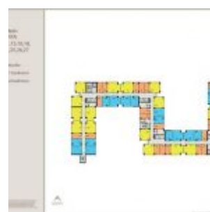
Denah Apartemen Sentraland Cengkareng

Apartemen Sentraland Cengkareng dijual dengan 3 pilihan tipe