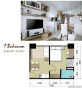
Apartemen Sentraland Cengkareng 1BR Type