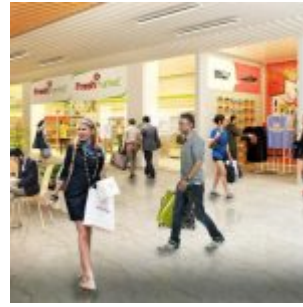
Retail Shop Sentraland Cengkareng