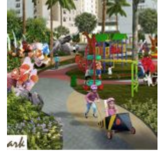
Nemo Park – Cengkareng Sentraland Apartment