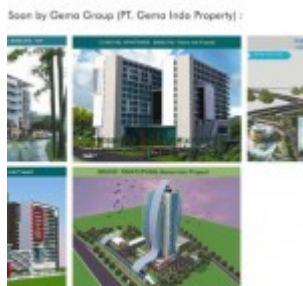
Proyek Baru Gema Indo