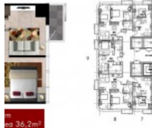
Type 1BR Grand Pancoran