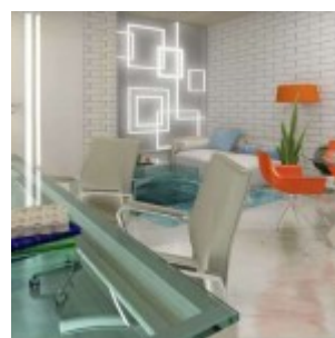
Design Interior 2BR