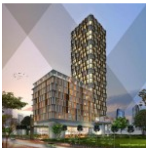
Apartemen Grand Pancoran

Gambar Apartemen Grand Pancoran, Gatot Subroto, Jakarta Selatan