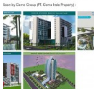
Proyek Baru Gema Indo