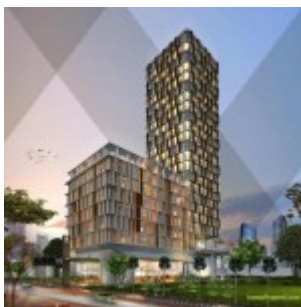
Apartemen Grand Pancoran

Gambar Apartemen Grand Pancoran, Gatot Subroto, Jakarta Selatan