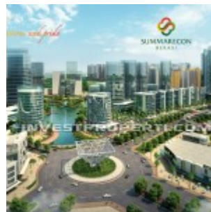
Bunderan Summarecon Bekasi