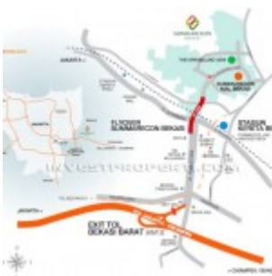
Summarecon Bekasi Map Location

Apartemen The Springlake View Summarecon Bekasi memiliki lokasi yang strategis di Bulevar Ahmad Yani, yang merupakan jantung kota Summarecon Bekasi. Dengan berbagai akses seperti prime akses utama flyover, akses jalan dekat pintu tol Cikampek Jakarta maupun Jakarta outer Ring Road dan juga terkoneksi Stasiun Commuter Line.