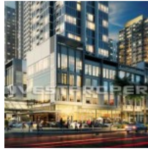
Apartemen The SpringLake View Bekasi