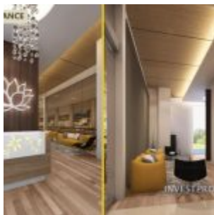
Lobby Tower Lotus