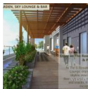
Roof Top Garden – B Residence BSD