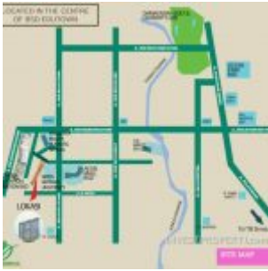
Peta Lokasi Apartemen B Residence