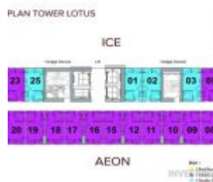
Floor Plan Lotus Tower