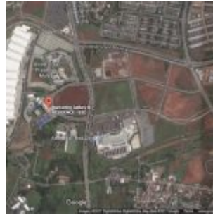
Google Map Apartemen B Residence

Berlokasikan sangat strategis dan premium di BSD City, B Residence apartment memiliki potensi sewa apartemen yang besar dimana tepat berada ditengah EDUTOWN BSD dengan beragam universitas dan sekolah disekeliling kawasan. Sebagai contoh: Prasetya Mulya dengan kapasitas hingga 15 ribu mahasiswa / wi, SGU, tepat di IULI University, Atmajaya BSD, IPEKA International School, Jakarta Nanyang School. Ditambah dengan lokasi yang sangat dekat dengan International Convention Centre BSD City, membuat B Residence sangat potensial untuk disewakan.