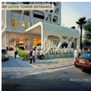
The Signature Lotus Tower – B Residence BSD

3. Signature Lotus Tower , merupakan gedung residensial dengan fasilitas tambahan yang menambah kenyamanan penghuni dengan Smart Home System dan Smart Door Lock System. Rencana serah terima bulan Des 2019.