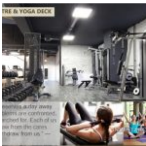
Fitness Centre – B Residence BSD