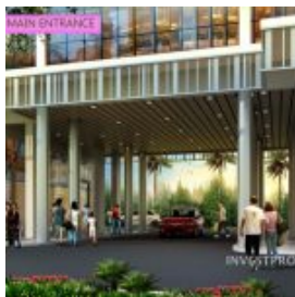
Tower Rose – B Residence BSD

2. Rose Tower , dengan jadual sera terima Juli 2019,