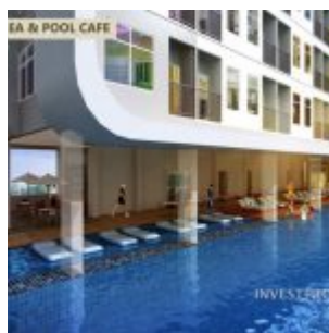
Pool Cafe – B Residence BSD