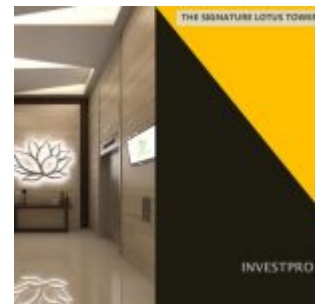
Lift – Lotus Tower B Residence