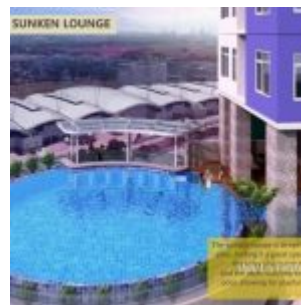
Pool Bar – B Residence BSD