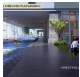
Kids Pool – B Residence BSD