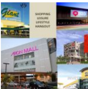
Shopping Mall Sekitar B Residence

Berlokasikan sangat strategis dan premium di BSD City, B Residence apartment memiliki potensi sewa apartemen yang besar dimana tepat berada ditengah EDUTOWN BSD dengan beragam universitas dan sekolah disekeliling kawasan. Sebagai contoh: Prasetya Mulya dengan kapasitas hingga 15 ribu mahasiswa / wi, SGU, tepat di IULI University, Atmajaya BSD, IPEKA International School, Jakarta Nanyang School. Ditambah dengan lokasi yang sangat dekat dengan International Convention Centre BSD City, membuat B Residence sangat potensial untuk disewakan.