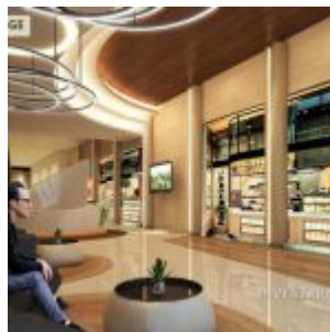
Lobby Lotus Tower B Residence