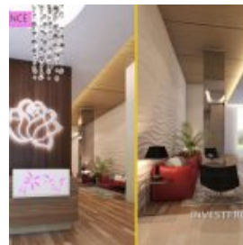
Lobby Tower Rose B Residence