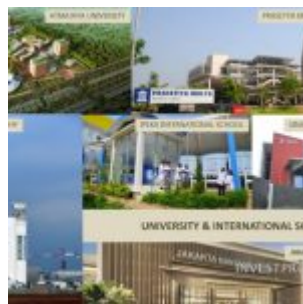
Universitas Sekitar B Residence