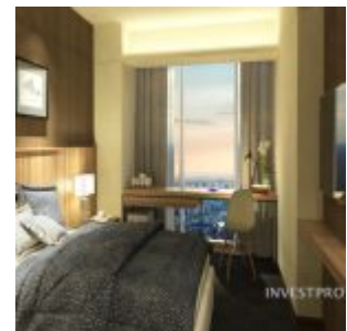
Studio Type Lotus Tower

Pilihan type unit apartemen B Residence yang dijual meliputi :