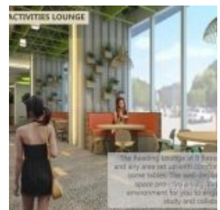
Reading Lounge – B Residence BSD