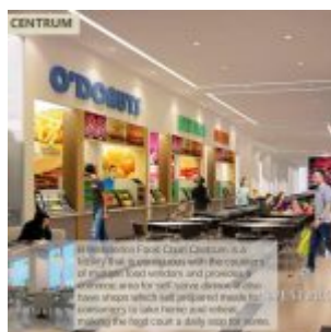
Food Court – B Residence BSD