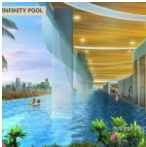
Swimming Pool – B Residence BSD

Beragam fasilitas lengkap dalam kawasan apartemen B Residence BSD, sebut saja seperti :