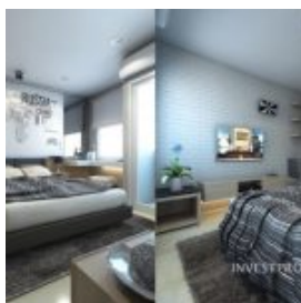
Tipe Studio –