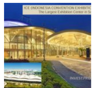
ICE BSD City

Penghuni apartemen B Residence dimanjakan dengan lokasi yang dekat dengan AEON Mall BSD dan tidak jauh dari The Breeze BSD City. Rumah sakit tidak jauh dengan adanya EKA Hospital dan