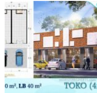
Toko Ayana Village Tigaraksa

Pilihan cara pembayaran ringan disediakan, antara lain :