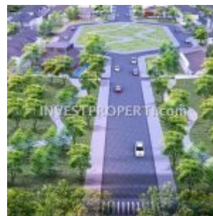
Alun-alun Ayana Village Tigaraksa