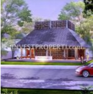
Mushola Ayana Village Tigaraksa