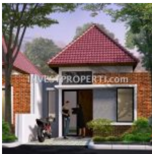
Cluster Ayana Village Regency Tigaraksa

AYANA Village Tigaraksa , pre-launching penjualan perdana rumah murah Rp. 128 jutaan di Tigaraksa, Tangerang. Memiliki lahan seluas 25 hektar, perumahan cluster murah Ayana Village Tangerang akan didevelop sehingga 5 cluster perumahan dengan total unit 1500 rumah.