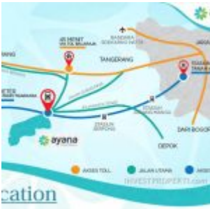
Peta Lokasi Ayana Village Regency Tigaraksa

Lokasi cluster Ayana Village sangat strategis bagi mereka yang sering menggunakan stasiun commuter KRL, karena kawasan Ayana sangat dekat dengan stasiun Tigaraksa Tangerang (berjarak 200 meter saja). Tidak perlu risau dengan kemacetan jalan toll lagi untuk bekerja di area Jakarta atau Jabodetabek.