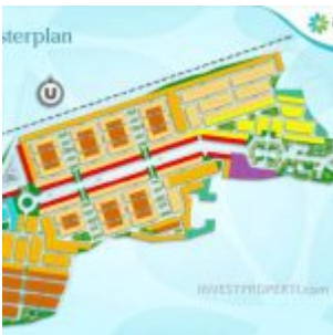
Master Plan Ayana Village Tigaraksa