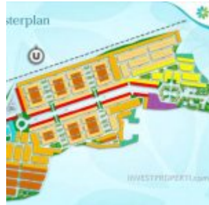
Master Plan Ayana Village Tigaraksa