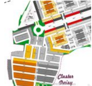
Launching Tahap 1 Ayana Village