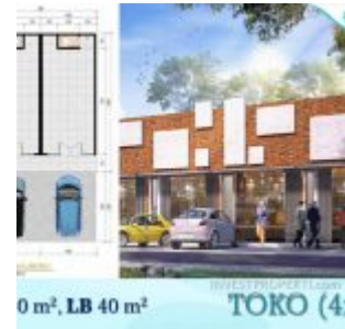
Toko Ayana Village Tigaraksa

Pilihan cara pembayaran ringan disediakan, antara lain :