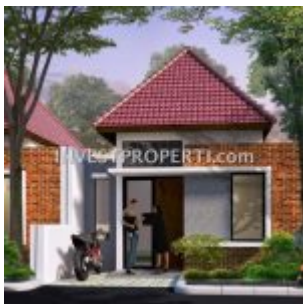
Cluster Ayana Village Regency Tigaraksa

AYANA Village Tigaraksa , pre-launching penjualan perdana rumah murah Rp. 128 jutaan di Tigaraksa, Tangerang. Memiliki lahan seluas 25 hektar, perumahan cluster murah Ayana Village Tangerang akan didevelop sehingga 5 cluster perumahan dengan total unit 1500 rumah.