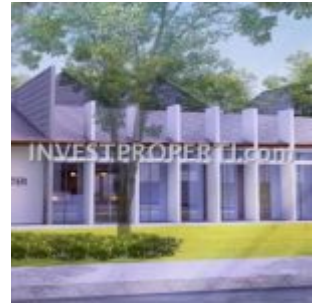
Medical Centre Ayana Village Tigaraksa

Kawasan cluster Ayana Village Tigaraksa dilengkapi dengan beragam fasilitas seperti :