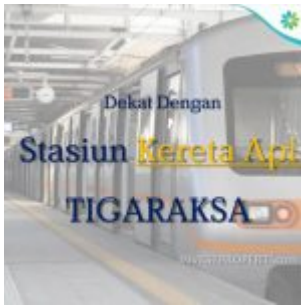
Rumah Dekat Stasiun Tigaraksa