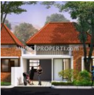
Rumah Ayana Village Tigaraksa Tangerang