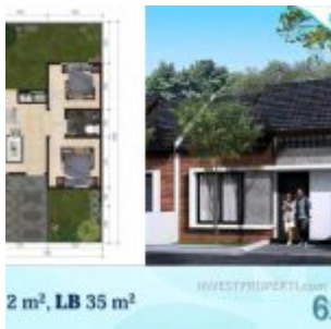
Ayana Village Tigaraksa Tipe 35