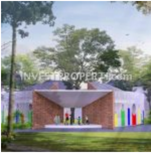
Sekolah Ayana Village Tigaraksa Tangerang