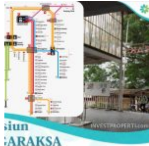
Ayana Village Cluster Dkt Stasiun Tigaraksa