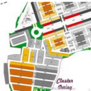
Launching Tahap 1 Ayana Village