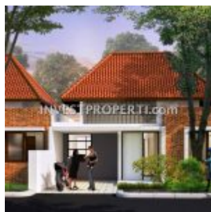
Rumah Ayana Village Tigaraksa Tangerang