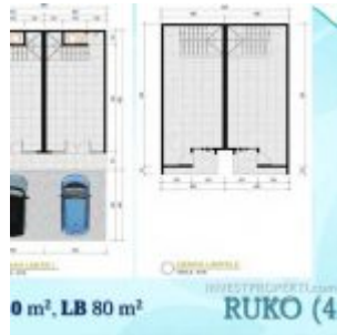
Denah Ruko Ayana Village Tangerang