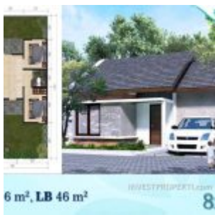
Ayana Village Tigaraksa Tipe 46

Terdapat juga kalving tanah siap bangun dijual seharga Rp. 50 jutaan.