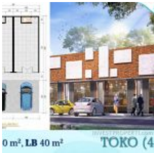
Toko Ayana Village Tigaraksa

Pilihan cara pembayaran ringan disediakan, antara lain :