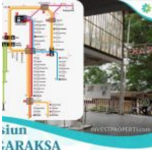
Ayana Village Cluster Dkt Stasiun Tigaraksa