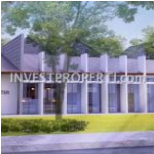
Medical Centre Ayana Village Tigaraksa

Kawasan cluster Ayana Village Tigaraksa dilengkapi dengan beragam fasilitas seperti :