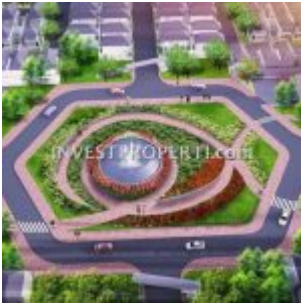
Bunderan Ayana Village Tigaraksa

Lokasi cluster Ayana Village sangat strategis bagi mereka yang sering menggunakan stasiun commuter KRL, karena kawasan Ayana sangat dekat dengan stasiun Tigaraksa Tangerang (berjarak 200 meter saja). Tidak perlu risau dengan kemacetan jalan toll lagi untuk bekerja di area Jakarta atau Jabodetabek.