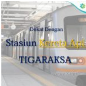
Rumah Dekat Stasiun Tigaraksa