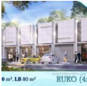
Ruko Ayana Village Tigaraksa

Anda pemilik usaha yang ingin mengembangkan sayap bisnis mereka, terdapat juga ruko baru dengan harga murah di cluster Ayana Village Tigaraksa dengan tipe 2 lantai, ukuran 4×10 m2 dan toko 1 lantai ukuran yang sama.