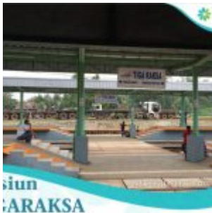
Stasiun Tigaraksa Tangerang

Nama Project : Ayana Village Regency (AVICY) .