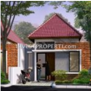
Cluster Ayana Village Regency Tigaraksa

AYANA Village Tigaraksa, pre-launching penjualan perdana rumah murah Rp. 128 jutaan di Tigaraksa, Tangerang. Memiliki lahan seluas 25 hektar, perumahan cluster murah Ayana Village Tangerang akan didevelop sehingga 5 cluster perumahan dengan total unit 1500 rumah.