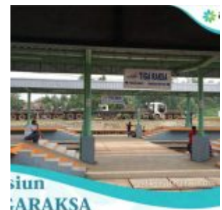
Stasiun Tigaraksa Tangerang

Nama Project : Ayana Village Regency (AVICY) .