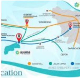
Peta Lokasi Ayana Village Regency Tigaraksa