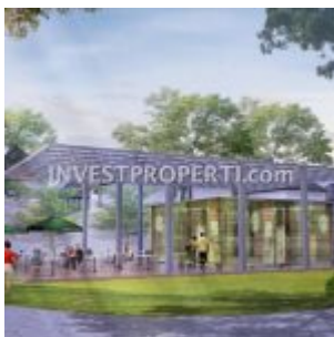
Mini Market Ayana Village Tangerang