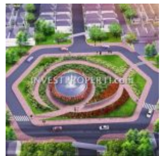
Bunderan Ayana Village Tigaraksa

Lokasi cluster Ayana Village sangat strategis bagi mereka yang sering menggunakan stasiun commuter KRL, karena kawasan Ayana sangat dekat dengan stasiun Tigaraksa Tangerang (berjarak 200 meter saja). Tidak perlu risau dengan kemacetan jalan toll lagi untuk bekerja di area Jakarta atau Jabodetabek.