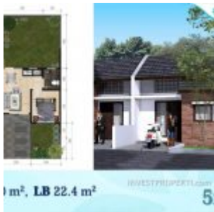
Ayana Village Tigaraksa Tipe 22