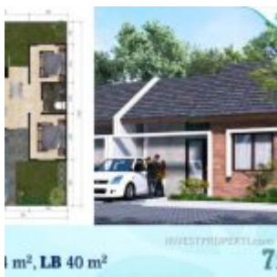
Ayana Village Tigaraksa Tipe 40