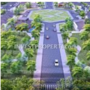
Alun-alun Ayana Village Tigaraksa