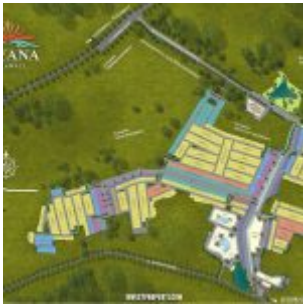
Site Plan Aryana Karawaci