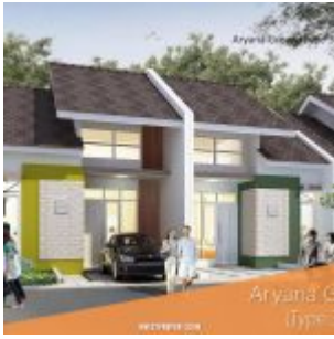
Rumah Aryana Green – Aryana Karawaci