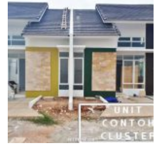
Rumah Contoh Aryana Green – Aryana Karawaci