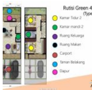
Rumah Rutisi Green – Aryana Karawaci