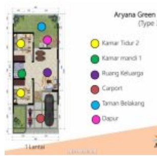
Denah Rumah Aryana Green – Aryana Karawaci