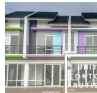
Rumah Contoh Rutisi Green – Aryana Karawaci