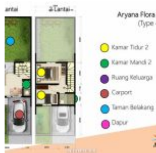
Denah Rumah Aryana Flora Karawaci