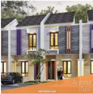
Rumah Aryana Flora Karawaci