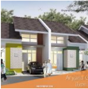
Rumah Aryana Green – Aryana Karawaci