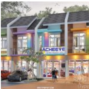
Cluster Rutisi Green – Aryana Karawaci