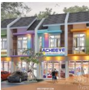
Cluster Rutisi Green – Aryana Karawaci