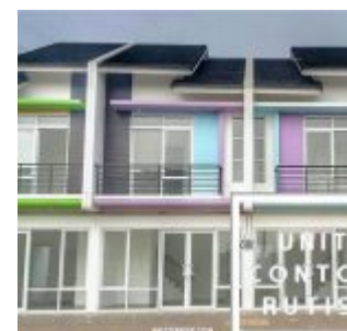
Rumah Contoh Rutisi Green – Aryana Karawaci