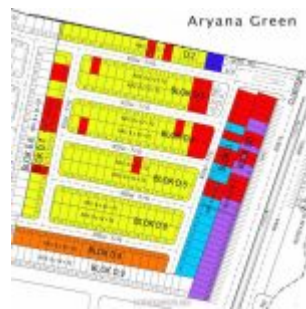
Cluster Aryana Green Karawaci