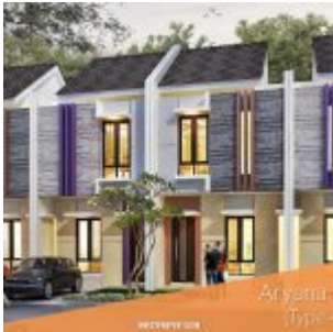
Rumah Aryana Flora Karawaci