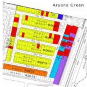
Cluster Aryana Green Karawaci