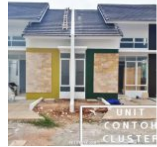
Rumah Contoh Aryana Green – Aryana Karawaci