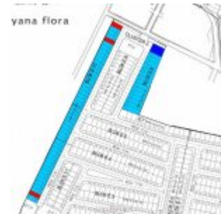
Site Plan Aryana Flora Karawaci

Rumah baru di cluster Aryana Karawaci dijual perdana, dengan pilihan tipe :