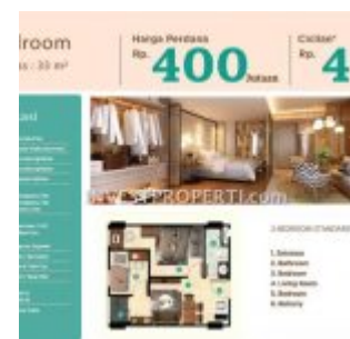
Tipe 2 BR Apartemen Serpong Garden