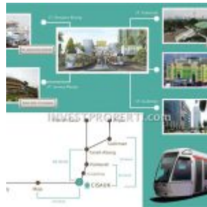
Akses Stasiun Cisauk – Serpong Garden Apartemen