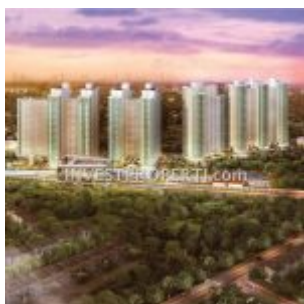
Serpong Garden Apartemen