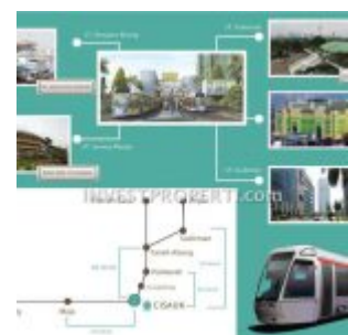
Akses Stasiun Cisauk – Serpong Garden Apartemen