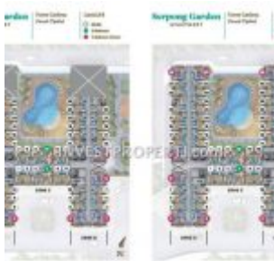
Floor Plan Apartemen Serpong Garden Tower Cattleya