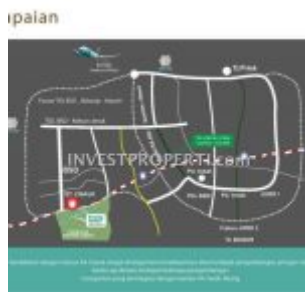
Peta Lokasi Apartemen Serpong Garden