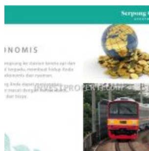
Akses Langsung Stasiun Kereta Cisauk