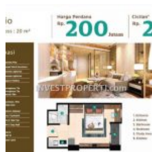
Tipe Studio Apartemen Serpong Garden