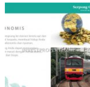
Akses Langsung Stasiun Kereta Cisauk