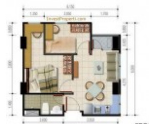
Unit 2 Kamar BCA- Apartemen Poris 88