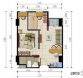
Unit 2 Kamar BCB- Apartemen Poris 88