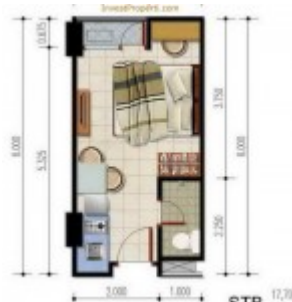
Unit Studio B Poris 88