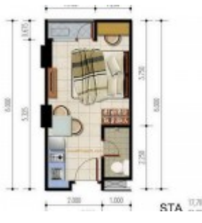
Unit Studio A Poris 88