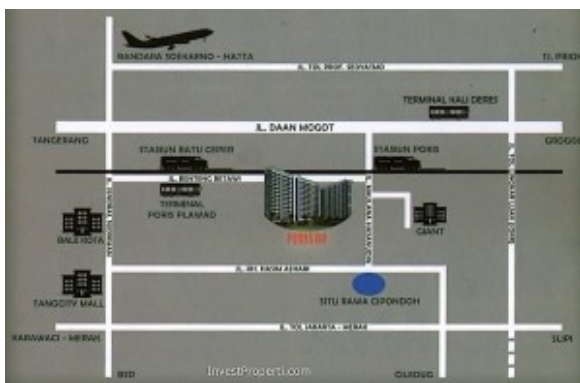
Peta lokasi Paris 88 apartemen

Hanya berjarak 1 km dari Daan Mogot Raya, apartemen Paris 88 memiliki lokasi yang strategis di Tangerang. Dekat dengan terminal bus Paris Plawad dan Kalideres dan stasiun kereta api Paris dan Batu Ceper, dan hanya berjarak 10 menit ke bandara internasional Soekarno Hatta.