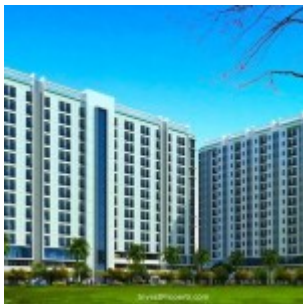
Apartemen Paris 88 Tangerang

Apartemen Paris 88 adalah apartemen terbaru di Paris Cipondoh Tangerang dengan harga murah. Dikembangkan oleh PT. Paris Benteng Betawi, Paris 88 akan dibangun diatas lahan seluas 16 hektar yang meliputi 2 tower apartemen, perkantoran / office dan perumahan didalam kawasannya.