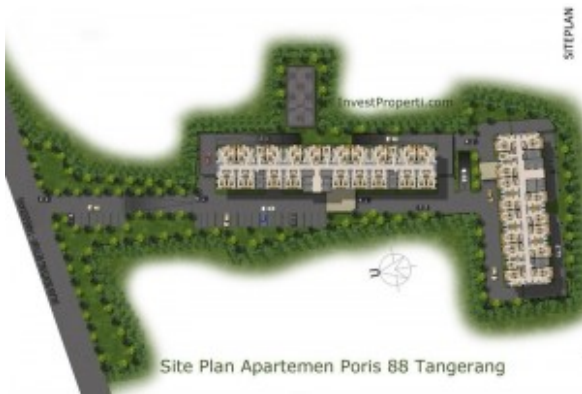
Site Plan Poris 88 Apartemen

Luas proyek Poris 88 : 16 hektar yang akan dibangun office, perumahan dan tower apartemen.