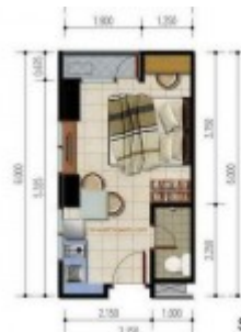
Unit Studio C Poris 88