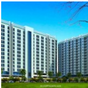
Apartemen Paris 88 Tangerang

Apartemen Paris 88 adalah apartemen terbaru di Paris Cipondoh Tangerang dengan harga murah. Dikembangkan oleh PT. Paris Benteng Betawi, Paris 88 akan dibangun diatas lahan seluas 16 hektar yang meliputi 2 tower apartemen, perkantoran / office dan perumahan didalam kawasannya.