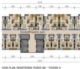
Floor Plan Apartemen Poris 88 Tower A

Total jumlah tower apartment ada 2 tower.