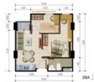
Unit 2 Kamar BA- Apartemen Poris 88