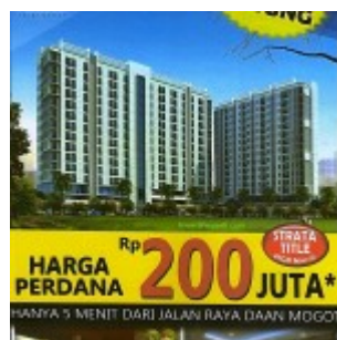
Brosur Flyer Apartemen Paris 88