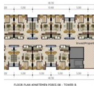
Floor Plan Apartemen Poris 88 Tower B