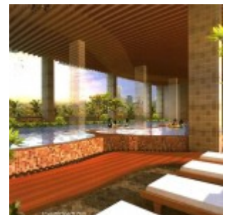
Kolam renang apartemen Paris 88

Hanya berjarak 1 km dari Daan Mogot Raya, apartemen Paris 88 memiliki lokasi yang strategis di Tangerang. Dekat dengan terminal bus Paris Plawad dan Kalideres dan stasiun kereta api Paris dan Batu Ceper, dan hanya berjarak 10 menit ke bandara internasional Soekarno Hatta.