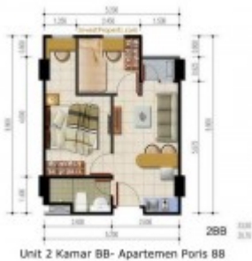
Unit 2 Kamar BB- Apartemen Poris 88