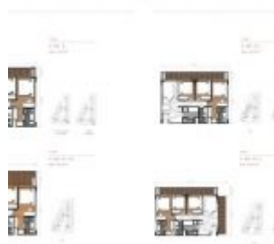
Unit 3 BR