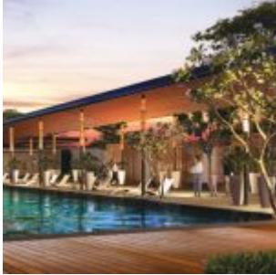
Kasamara Apartment Pool