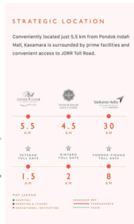
Kasamara Apartment Map Location