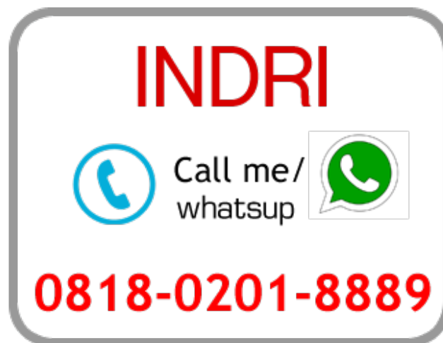
Sales Marketing Indri

Hubungi sales marketing apartemen mewah low rise pertamaa di Jakarta Selatan – KAMASARA Apartment sekarang !