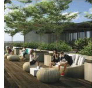
Roof Top Garden