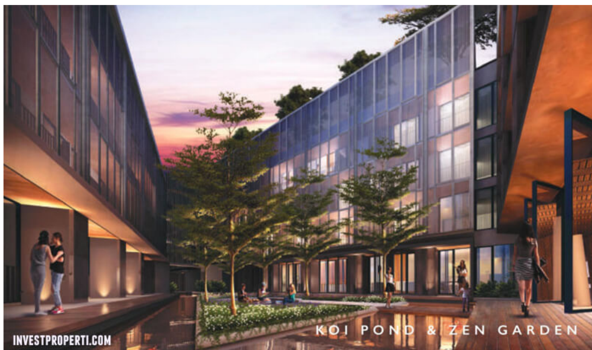
Koi Pond & Zen Garden