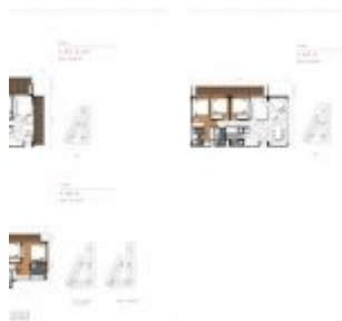
Unit 3 BR