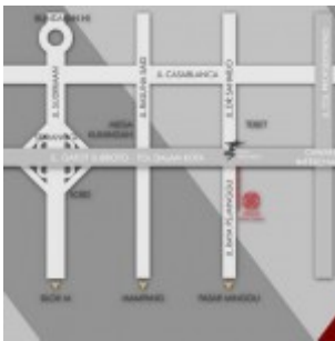
Peta Lokasi Apartemen Grand Pancoran

Gambar siteplan dan peta lokasi Apartemen Grand Pancoran