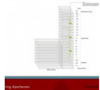
Lantai Apartemen Grand Pancoran