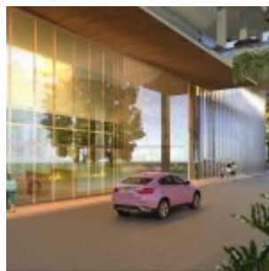
Lobby Apartemen Grand Pancoran