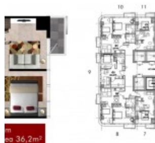
Type 1BR Grand Pancoran