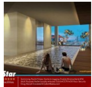
Pool Grand Pancoran Apartment