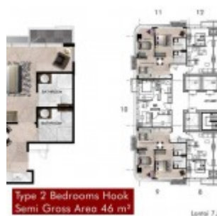
Type 2BR Hook Grand Pancoran