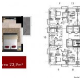
Type Studio Grand Pancoran