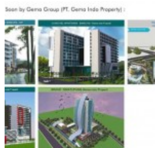
Proyek Baru Gema Indo