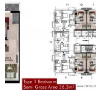
Type 1BR Grand Pancoran