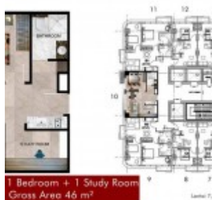
Type 1BR 1ST Grand Pancoran