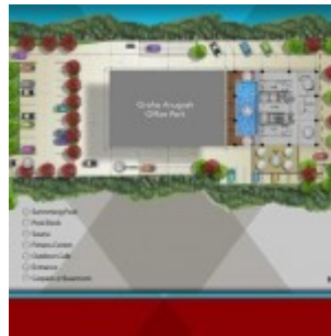
Site Plan Grand Pancoran