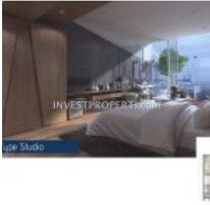
Apartemen Carstenz Residence BSD Interior Design