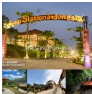
JSI Resort Mega Mendung Puncak Bogor