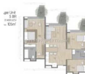
Denah 3BR Carstensz Residence BSD