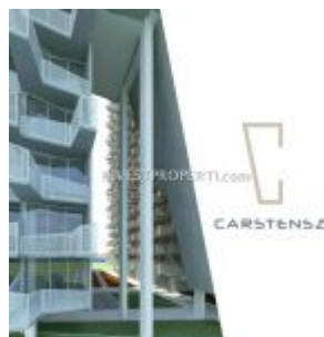
Brosur Apartemen Carstensz BSD