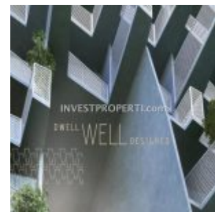
Design Apartemen Carstensz Residence BSD