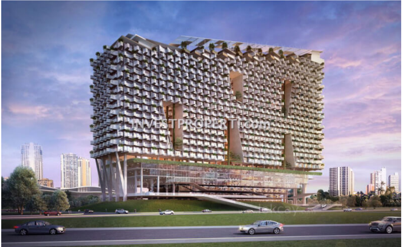
Apartemen Carstenz BSD City

Arsitek, Landscape dan Master Planner : Studio Tonton.