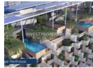
Penthouse Carstenz Residence BSD

Carstenz Residence Serpong dijual perdana dengan pilihan tipe unit sebagai berikut: