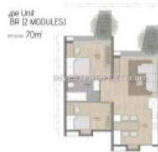
Denah 2BR Carstensz Residence BSD