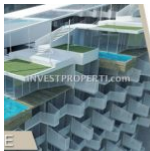
Apartemen Carstensz BSD