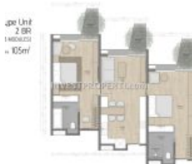
Denah 2BR Carstensz Residence BSD