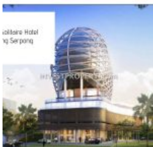
JHL Solitaire Hotel Gading Serpong

Beragam portfolio JHL Group dalam residential dan commercial development di berbagai kota besar di Indonesia antara lain :