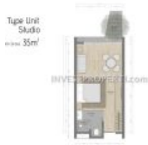
Denah Studio Carstensz Residence BSD