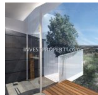
View Apartemen Carstensz BSD City