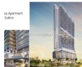
La Casa Apartment Alam Sutera