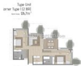
Denah 2BR Carstensz Residence BSD