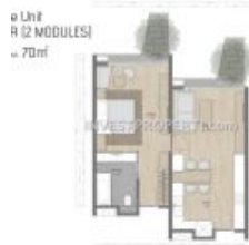
Denah 1BR Carstensz Residence BSD