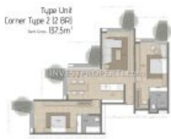
Denah 2BR Carstensz Residence BSD