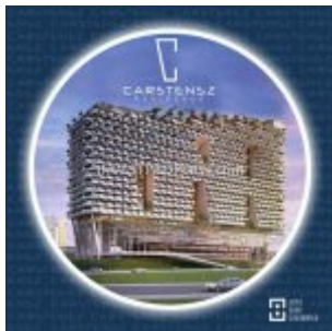
Carstensz Residence BSD Apartment

Carstensz Residence , apartemen terbaru di Serpong BSD dijual perdana dengan harga mulai dari Rp. 700 jutaan. Apartemen Carstensz terletak di jantung kota BSD City dengan beragam fasilitas lengkap disekitar apartemen.