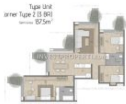
Denah 3BR Carstensz Residence BSD