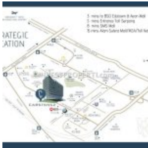
Peta Lokasi Carstensz Residence BSD