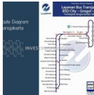
Peta Transjakarta BSD City

Lokasi Carstensz Residence apartemen sangat strategis di kawasan pengembangan kota baru BSD City, dengan: