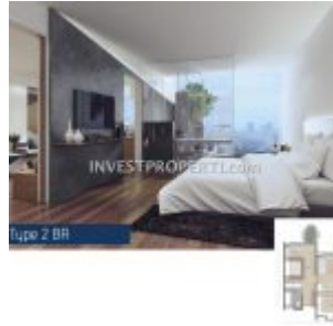
Apartemen Carstenz Residence BSD 2 BR Interior Design