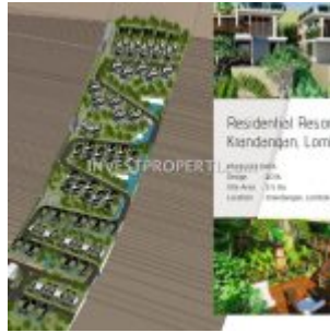
Residential Resort Villa Krandangan Lombok