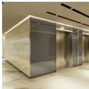
Interior Design Twenty Thamrin Lippo