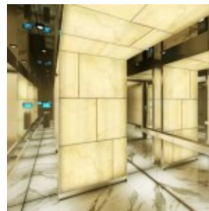
Interior Kantor Twenty Thamrin Lippo