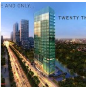
Twenty Thamrin – Lippo Thamrin Office