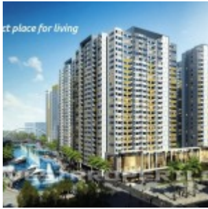
The SpringLake View Apartment Bekasi