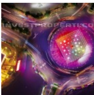
Landmark Summarecon Bekasi