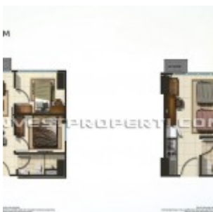
Tipe Unit Apartemen Summarecon Bekasi