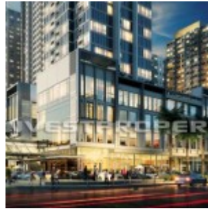
Apartemen The SpringLake View Bekasi