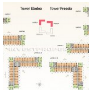
Floorplan Apartemen SpringLake View Bekasi