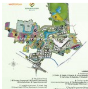
Master Plan Summarecon Bekasi

Nama Proyek : The SpringLake View Apartment @ Summarecon Bekasi