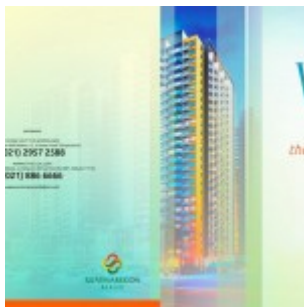
Brosur Apartemen Summarecon Bekasi

Info pre-launching penjualan apartemen The SpringLake View Summarecon Bekasi bulan Agustus 2015 ini. Investasi apartemen terbaru di Summarecon Bekasi yang ditunggu telah tiba. Apartemen The Springlake View Bekasi ini dijual dengan harga pre-launching perdana (tahap 1) mulai daripada Rp. 375 jutaan untuk tipe unit Studio.