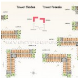
Floorplan Apartemen SpringLake View Bekasi