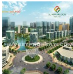
Bunderan Summarecon Bekasi