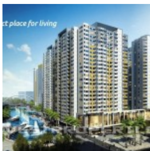
The SpringLake View Apartment Bekasi