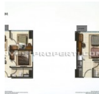
Tipe Unit Apartemen Summarecon Bekasi