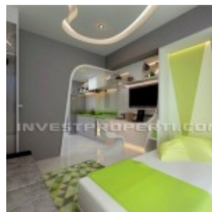
Show Unit Studio