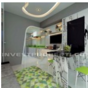
Show Unit Studio