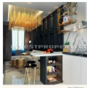
Show Unit 2 Bedrooms