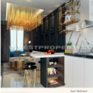
Show Unit 2 Bedrooms