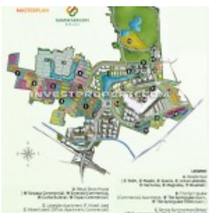
Master Plan Summarecon Bekasi

Nama Proyek : The SpringLake View Apartment @ Summarecon Bekasi