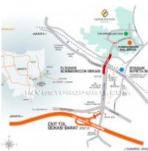
Summarecon Bekasi Map Location

Apartemen The Springlake View Summarecon Bekasi memiliki lokasi yang strategis di Bulevar Ahmad Yani, yang merupakan jantung kota Summarecon Bekasi. Dengan berbagai akses seperti prime akses utama flyover, akses jalan dekat pintu tol Cikampek Jakarta maupun Jakarta outer Ring Road dan juga terkoneksi Stasiun Commuter Line.