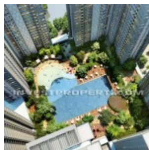
Apartemen SpringLake Bekasi Pool