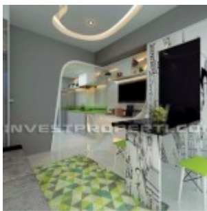
Show Unit Studio