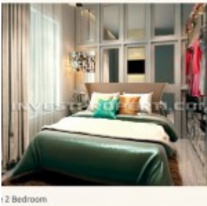
Show Unit 2 Bedrooms

Kawasan the SpringLake dikembangkan dalam konsep Lake Front Vertikal Living, sebuah kehidupan yang nyaman ditepi danau dalam hunian apartemen berbalut gaya hidup modern yang serba praktis dan dinamis. The SpringLake menjadi sebuah oase baru yang menenangkan dengan konsep landscape & hardscape yang menarik serta kelengkapan fasilitasnya.