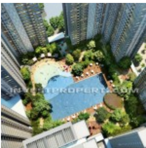
Apartemen SpringLake Bekasi Pool

Fasilitas pendukung sekitar The SpringLake View Apartment Summerecon Bekasi meliputi: