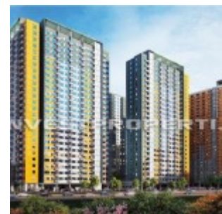
SpringLake View Apartment Summarecon Bekasi