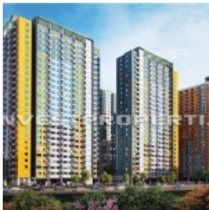
SpringLake View Apartment Summarecon Bekasi