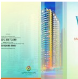
Brosur Apartemen Summarecon Bekasi

Info pre-launching penjualan apartemen The SpringLake View Summarecon Bekasi bulan Agustus 2015 ini. Investasi apartemen terbaru di Summarecon Bekasi yang ditunggu telah tiba. Apartemen The Springlake View Bekasi ini dijual dengan harga pre-launching perdana (tahap 1) mulai daripada Rp. 375 jutaan untuk tipe unit Studio.