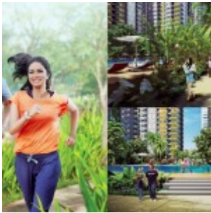
The SpringLake View Apartment Facilities