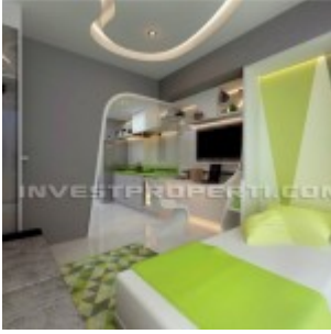
Show Unit Studio