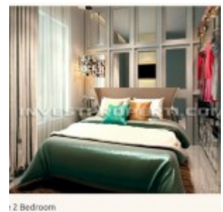
Show Unit 2 Bedrooms

Kawasan the SpringLake dikembangkan dalam konsep Lake Front Vertikal Living, sebuah kehidupan yang nyaman ditepi danau