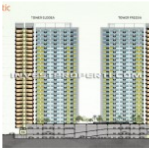
Schematic The SpringLake View Apartment

b. Tipe 2 Bedroom, ukuran semigross : 45,12 m 2 .