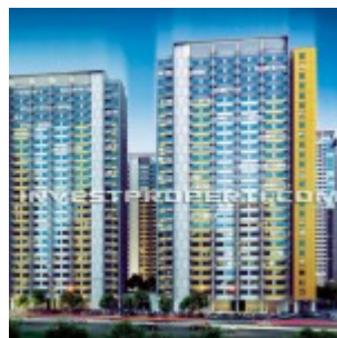
The SpringLake View Apartment Summarecon Bekasi