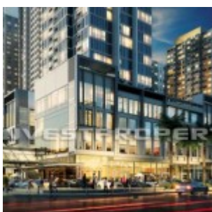
Apartemen The SpringLake View Bekasi