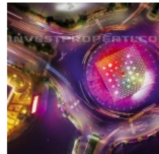
Landmark Summarecon Bekasi