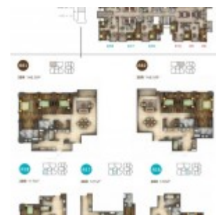
Unit Antasari Heights Apartment