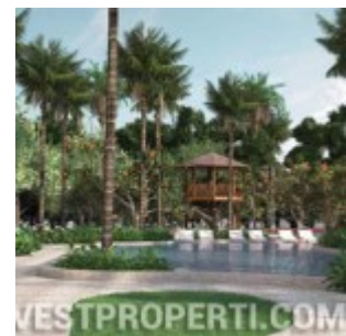
Antasari Heights Apartment Pool