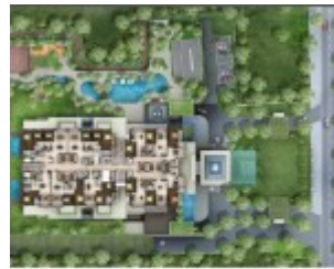
Site Plan Antasari Heights Apartment Jakarta Selatan