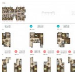
Floor Plan Antasari Heights Apartment