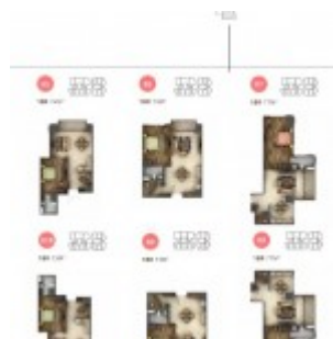
Unit Antasari Heights Apartment