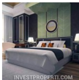
Master Bedroom Antasari Heights Apartment Jakarta

Konsep apartemen Antasari Heights Residences adalah modern classic exclusive dengan konsep single use yang didukung oleh berbagai facilities yang lengkap untuk memanjakan penghuninya. Luas lahan adalah 1 hektar dengan 65% green area, dengan 1