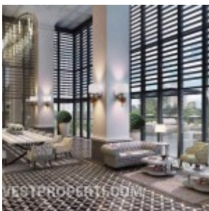
Antasari Heights Jakarta Tea Room