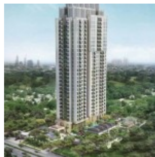
Antasari Heights Jakarta Selatan