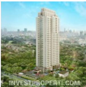
Apartemen Antasari Heights

Antasari Heights Residences , apartemen eksklusif terbaru di Jakarta Selatan daripada PT. Randika Quantro Land. Investasi apartemen yang sangat menguntungkan di Jakarta Selatan mengingat lokasi emas di area perumahan super elite, diapit oleh Simatupang dan Sudirman CBD.